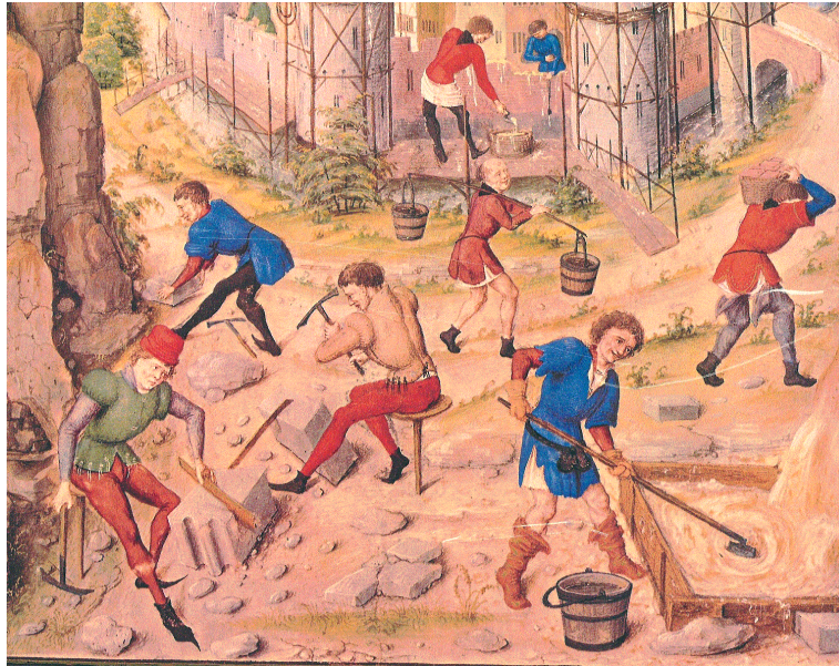
Dalle "Cronache del regno dei crociati di Gerusalemme", codice miniato: la ricostruzione di Gerusalemme (particolare), metà del XV secolo Biblioteca Nazionale Austriaca – Vienna cod. 2533

Città di Busto Arsizio (Provincia di Varese)