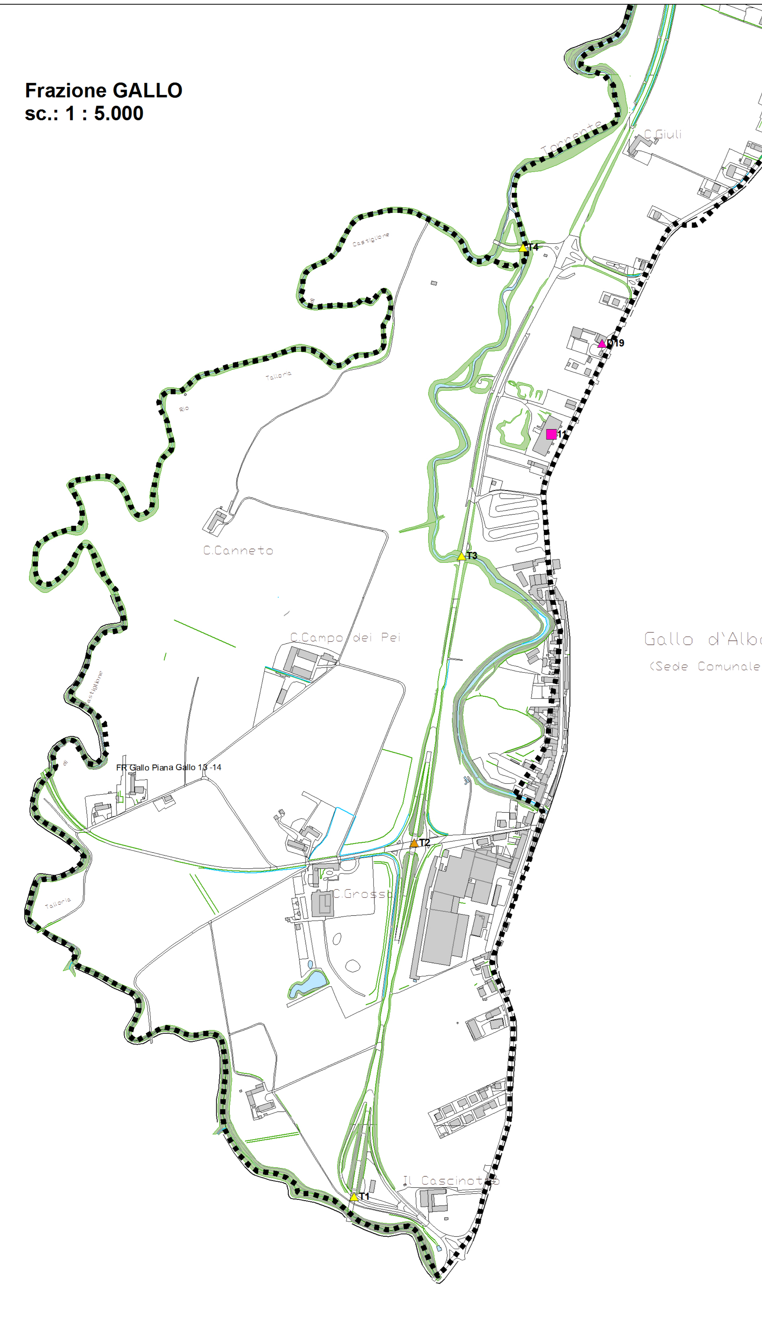
Frazione GALLO sc.: 1 : 5.000