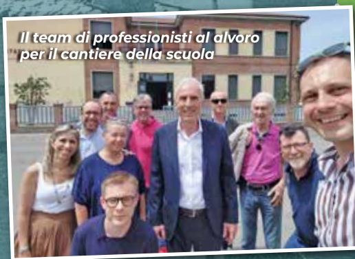
Il team di professionisti al lavoro per il cantiere della scuola

Nell'estate 2025 l'edificio scolastico sarà "scoperchiato", con il rifacimento completo del tetto. Verrà anche restaurata la facciata, per completare la riqualificazione dell'immobile di impronta razionalista