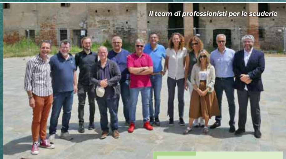
Il team di professionisti per le scuderie

Nel 2023 sono stati appaltati i lavori per il restauro delle scuderie. Dureranno due anni, fino alla primavera del 2026. L'edificio diventerà la nuova sede della biblioteca comunale e di locali per l'accoglienza dei pellegrini della Via Francigena. L'investimento complessivo è di 2 milioni 400mila euro, finanziati principalmente dalla Regione Emilia-Romagna con 1 milione 120mila euro.