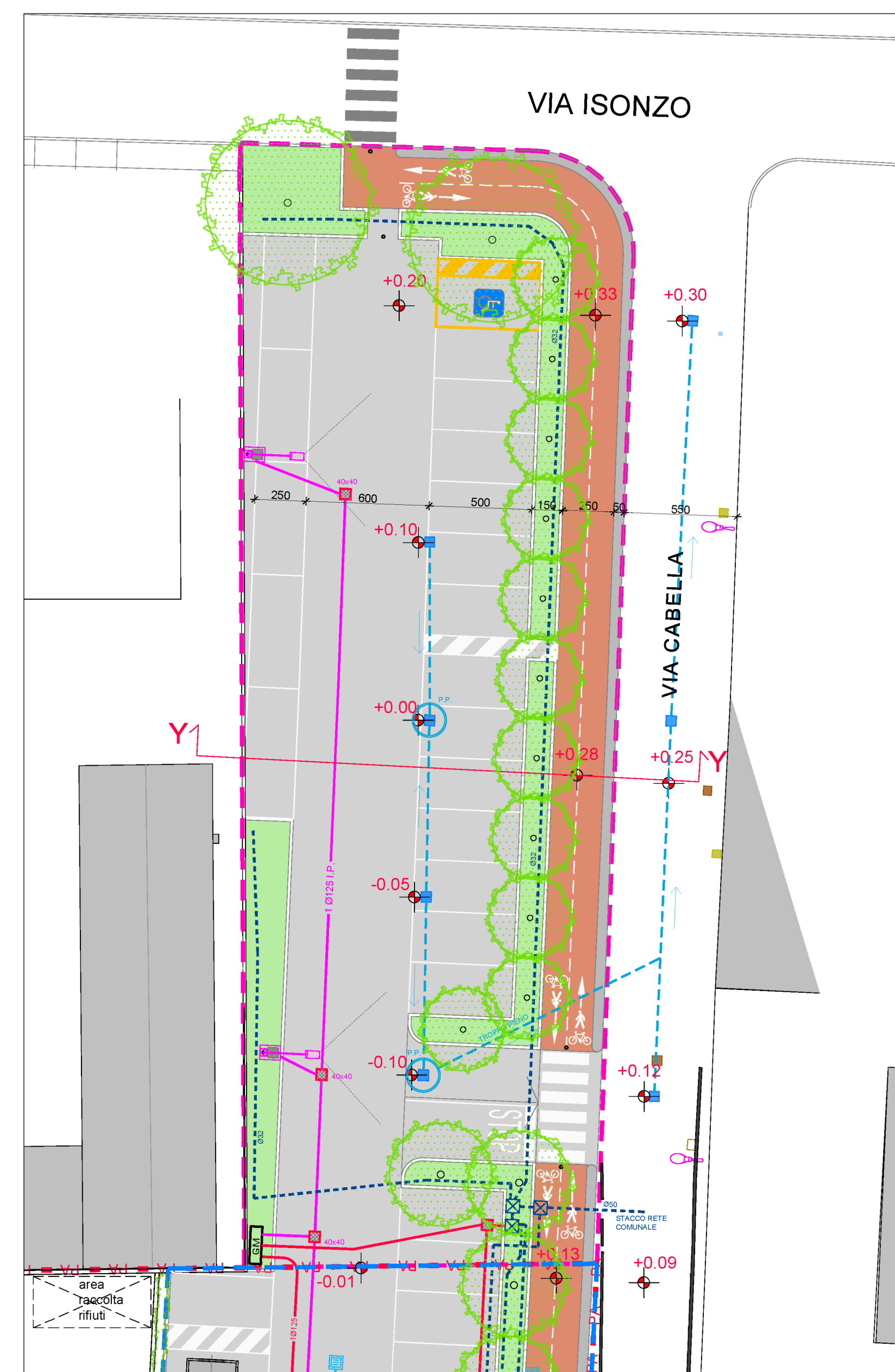
LEGENDA PERIMETRO PIANO DI LOTTIZZAZIONE VERDE PUBBLICO PISTA CICLO-PEDONALE IN PROGETTO AREA A PARCHEGGIO AREA A STANDARD IN CESSIONE AREE ESTERNE AL P.L. DA RIQUALIFICARE QUOTE IN PROGETTO RETE FOGNATURE ACQUE BIANCHE Caditoia stradale esistente Linea tombinatura esistente Pozzo perdente esistente RETE PUBBLICA ILLUMINAZIONE Illuminazione pubblica esistente Rete Illuminazione Pubblica Ø125 tubo corrugato (in progetto) Anello 40x40 con chiusura in ghisa sferoidale (in progetto) Pali fino a 8m, sbraccio fino a 2m e proiettore a LED. (in progetto) Pozzetto-pilino per palo Pubbl. Illuminazione 70x100x100 con tasca quadrata da 40x40 interna e tasca circolare Ø27 con chiusura in ghisa sferoidale C250 luce 44x44 (in progetto) RETE IDRICA Rete idrica Ø50 / Ø32 PEAD (in progetto) Pozzetto per collocamento elettrovalvole (in progetto)