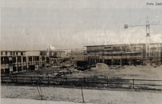
Questo è il più bel posto del nostro paese, non perchè non esistono angoli più suggestivi ma è qui che stanno sorgendo opere che porteranno nuovi servizi o ne miglioreranno altri già esistenti.

Nella foto: le costruzioni a sinistra asilo nido a destra un'ala della scuola media.