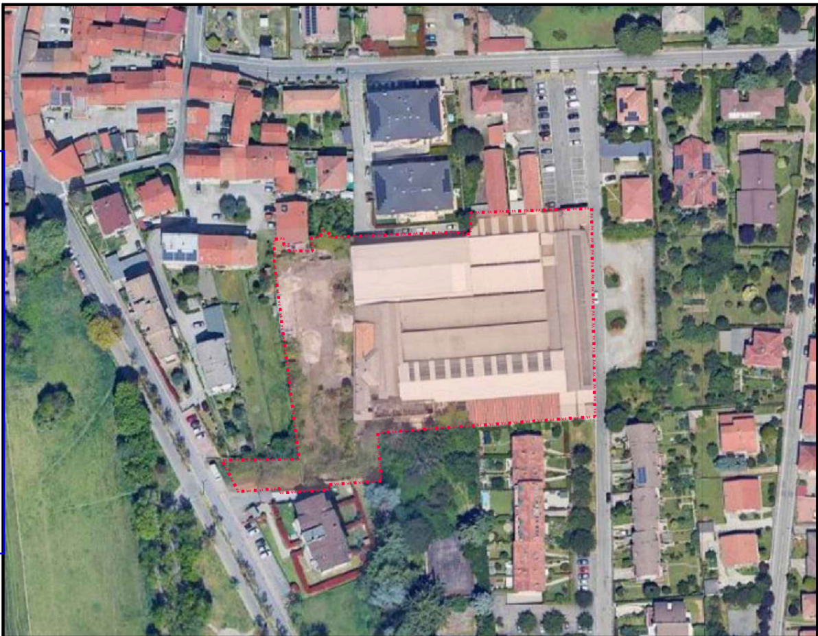
VISTA SATELLITARE comparto ex Vetreria Restelli

PIANO DI LOTTIZZAZIONE EX VETRERIA RESTELLI