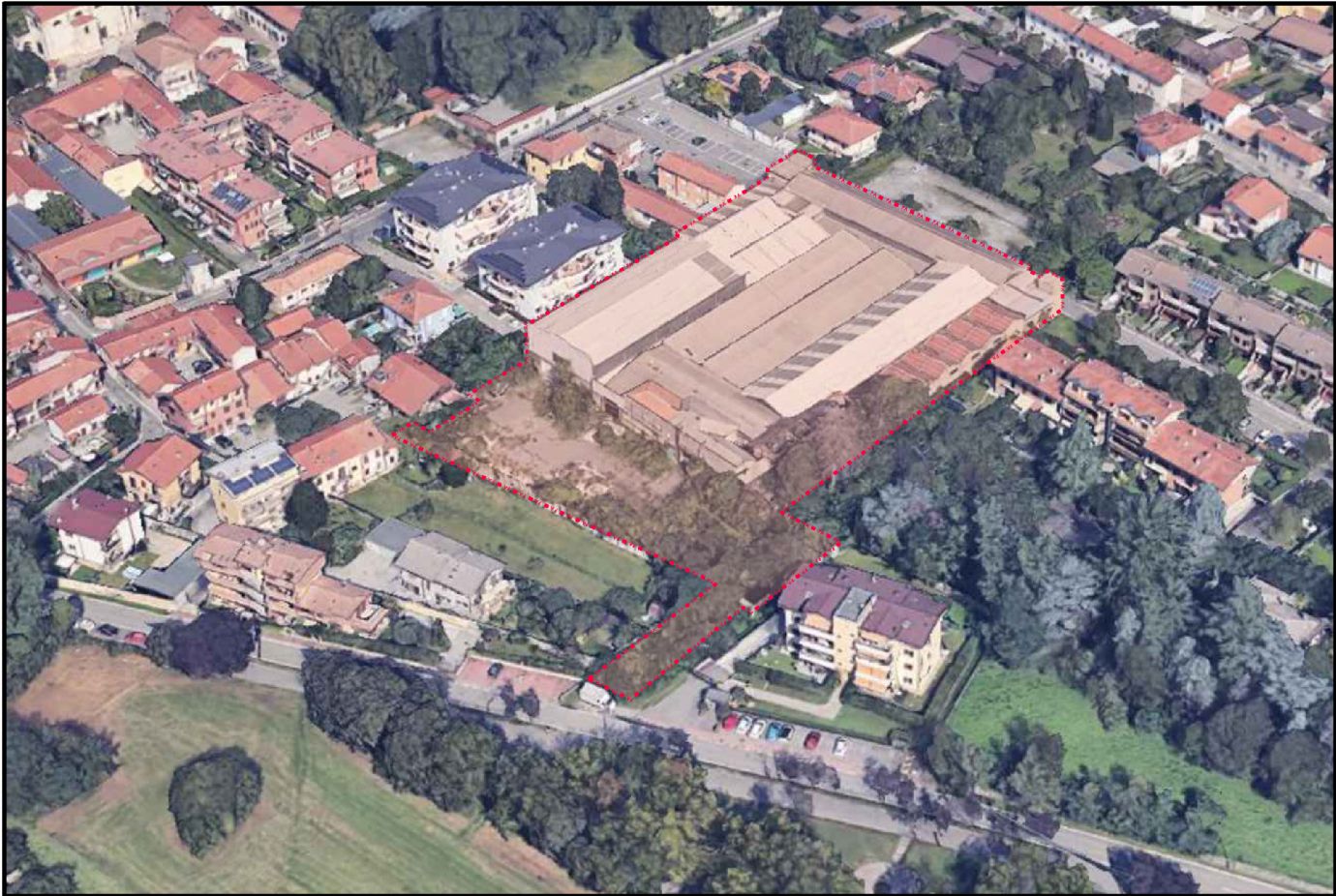
VISTA 3D 1