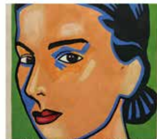
2° posto - Rebecca Delgado