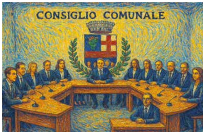
Immagine creata con AI

da sezioni provinciali o regionali. Il nostro unico criterio di valutazione è la coerenza con il programma presentato ai cittadini e l'utilità delle decisioni per la comunità.