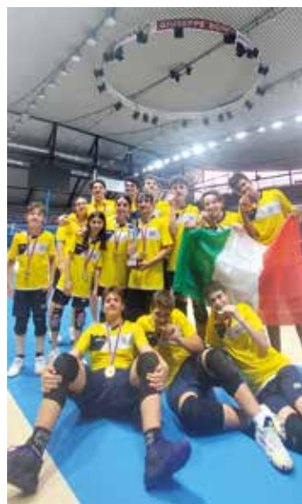
Campioni d'Italia di Tchoukball