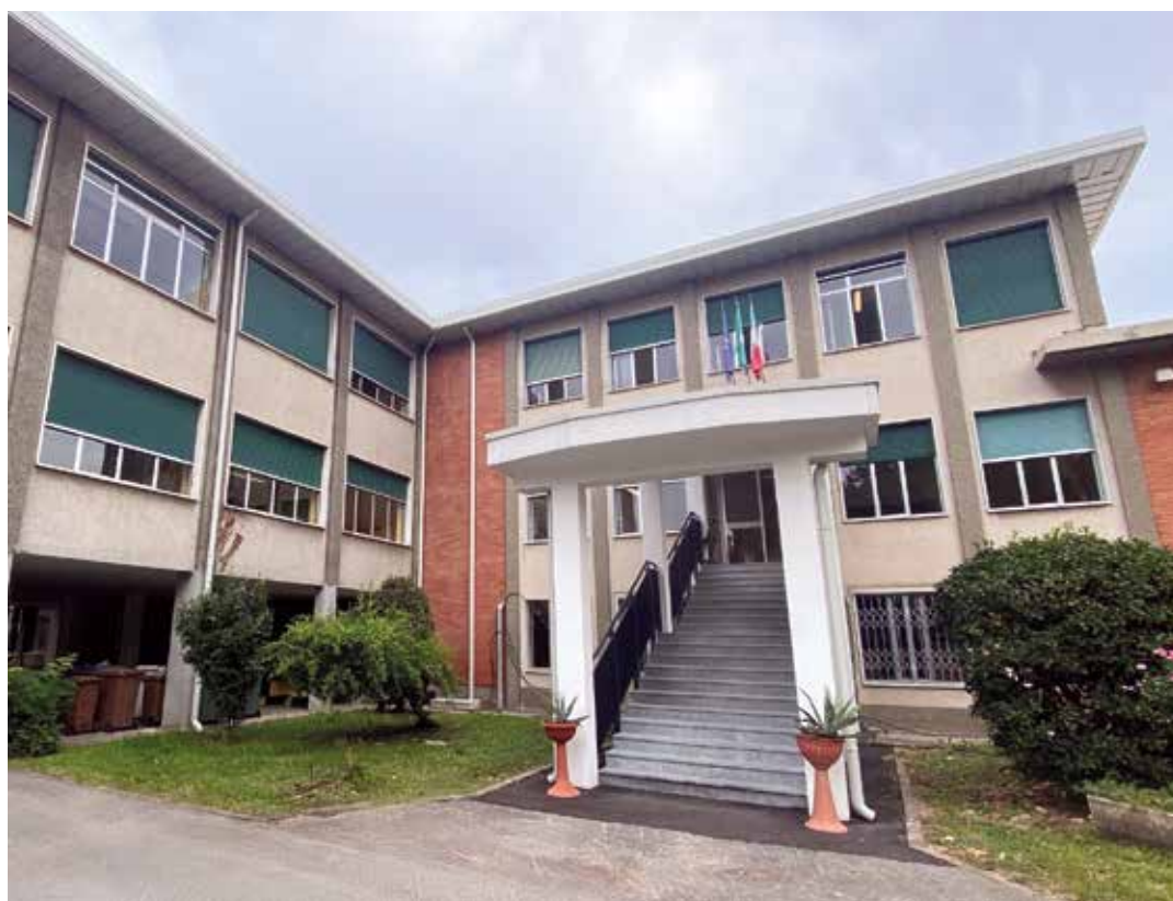
Scuola Secondaria di I° Grado "A. De Gasperi"

Una scuola che sia per gli alunni ambiente di apprendimento innovativo, creativo, stimolante e inclusivo, nel quale sviluppare i valori fondanti della vita e che rappresenti per gli studenti l'occasione di costruire un progetto efficace di studio e di lavoro.