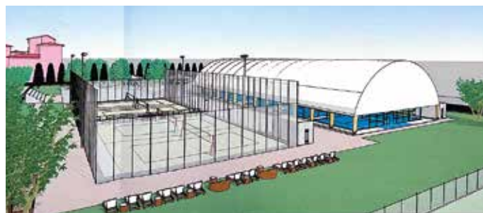
Vista prospettica aerea - campi da beach-volley e padel versione estiva

Si tratta di una proposta di Partenariato Pubblico-Privato (PPP) di iniziativa privata, che prevede una durata del contratto di concessione pari ad anni 21 decorrenti dalla data di sottoscrizione del Contratto o, se diversa, dalla data di immissione di disponibilità dell'opera.