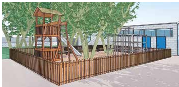
Vista prospettica area ludica bimbi