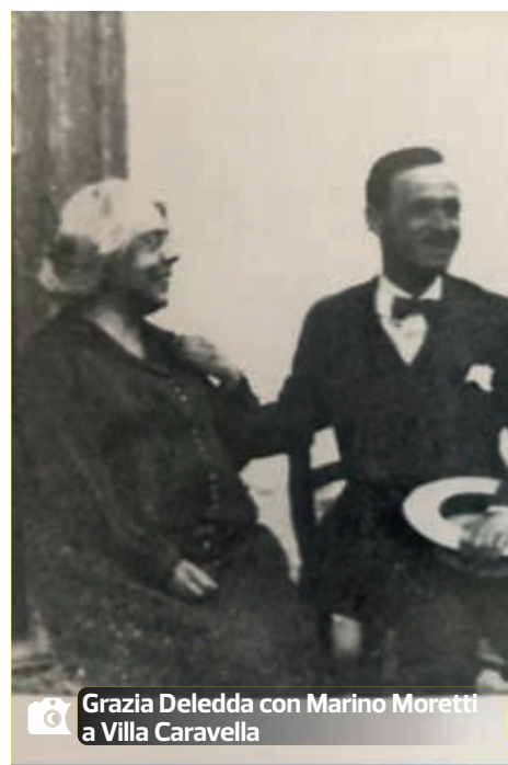
Grazia Deledda con Marino Moretti a Villa Caravella

'Eccomi cervese come lei': sono le prime parole che la Deledda dice in questa occasione rivolta all'amica