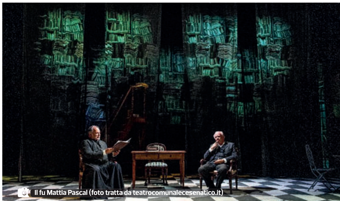
Il fu Mattia Pascal