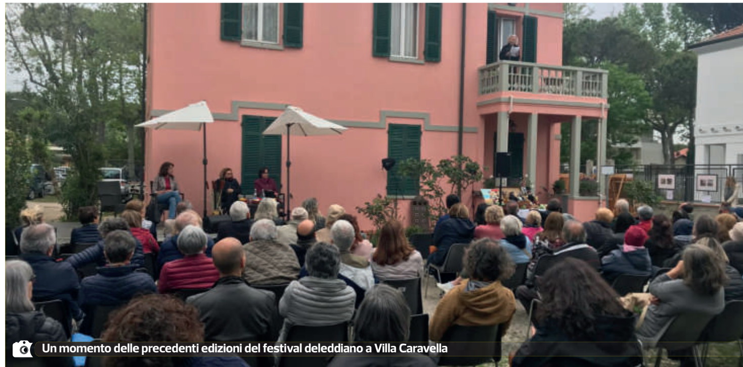
Un momento delle precedenti edizioni del festival deleddiano a Villa Caravella

Per Cervia, si aggiungono motivazioni specifiche? "Certo. Perché grata a lei deve essere proprio la 'bella-verde ventosa' Cervia, come la scrittrice definiva la nostra città, dove ha trascorso quindici estati e in cui ha ambientato novelle e roman-