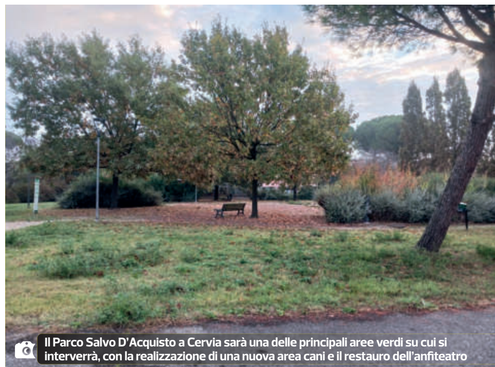
Il Parco Salvo D'Acquisto a Cervia sarà una delle principali aree verdi su cui si interverrà, con la realizzazione di una nuova area cani e il restauro dell'anfiteatro

A seconda delle necessità rilevate parco per parco, si procederà alla rimozione delle pavimentazioni deteriorate e alla loro sostituzione con