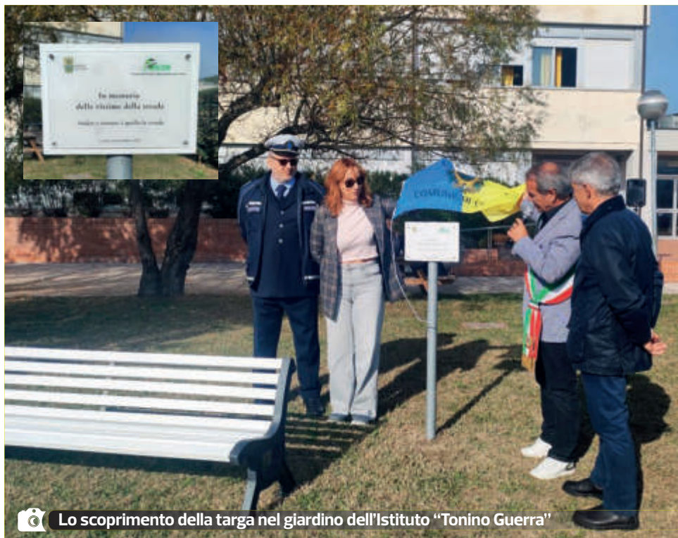
Lo scoprimento della targa nel giardino dell'Istituto "Tonino Guerra"

Una panchina bianca, come simbolo di memoria, riflessione e cittadinanza attiva è stata inaugurata il 14 novembre nell'area verde dell'Istituto di Istruzione Superiore "T. Guerra" di Cervia. Realizzata in memoria delle vittime della strada, la panchina bianca è stata scoperta durante una cerimonia pubblica che ha visto la partecipazione delle autorità locali, dei rappresentanti delle Forze dell'Ordine e delle associazioni impegnate nella sensibilizzazione sulla sicurezza stradale.