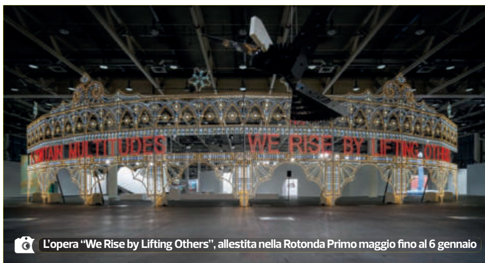
L'opera " We Rise by Lifting Others ", allestita nella Rotonda Primo maggio fino al 6 gennaio