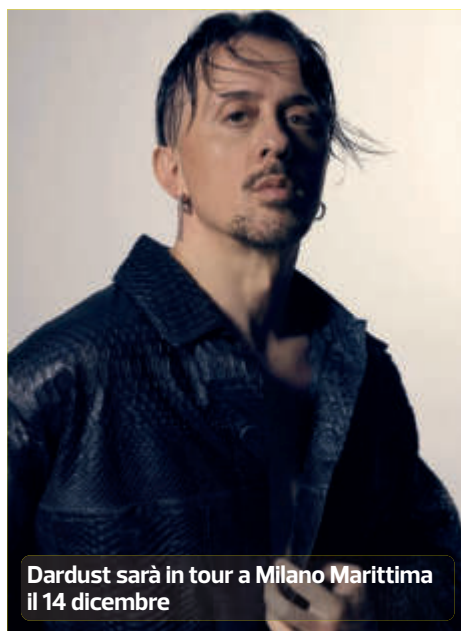
Dardust sarà in tour a Milano Marittima il 14 dicembre

derica Bosi - che per Natale diventa un eccezionale percorso di arte contemporanea, che unisce le straordinarie opere di Marinella Senatore e Valerio Berruti. L'installazione " We Rise by Lifting Others " di Senatore, insieme alla suggestiva " Sirena " di Berruti, invita i visitatori a immergersi in un'esperienza unica, dove la luce (entrambe le opere sono illuminate) diventa il filo conduttore di un dialogo visivo e emozionale. Questa