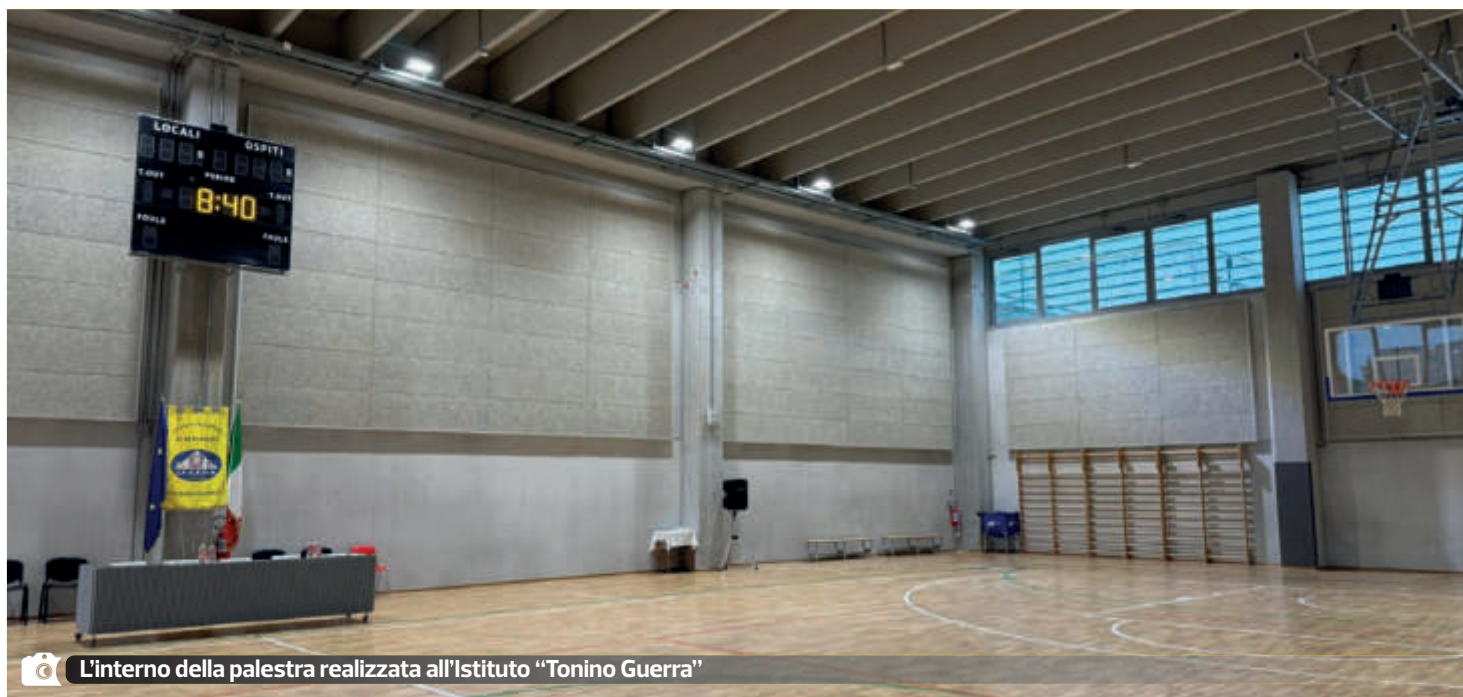
L'interno della palestra realizzata all'Istituto "Tonino Guerra"

Il fabbricato si sviluppa su due piani, il piano terra è interamente dedicato alle attività sportive, con una superficie di gioco dimensionata in modo da poter contenere i campi per la pallavolo, il basket e il calcio a 5 e finalizzata ad ottenere l'omologazione del Coni. A questa area sono connessi due spogliatoi separati per studentesse, studenti, atlete e atleti e due spogliatoi per i docenti e i giudici di gara, tutti dotati di docce e servizi igienici. Al secondo piano è collocata una tribuna per gli spettatori, modulabile per funzionare anche da aula magna dell'istituto per un totale di 250 posti. Lo spazio è stato progettato per garantire l'accessibilità e la fruibilità completa alle persone con disabilità, compresi i servizi igienici, grazie a rampe di accesso e ascensori. La palestra dell'istituto "Tonino Guerra" è all'avanguardia anche dal punto di vista della sostenibilità ambientale; l'edificio è stato concepito per operare in modo ecologico e autonomo: l'impiego di un impianto