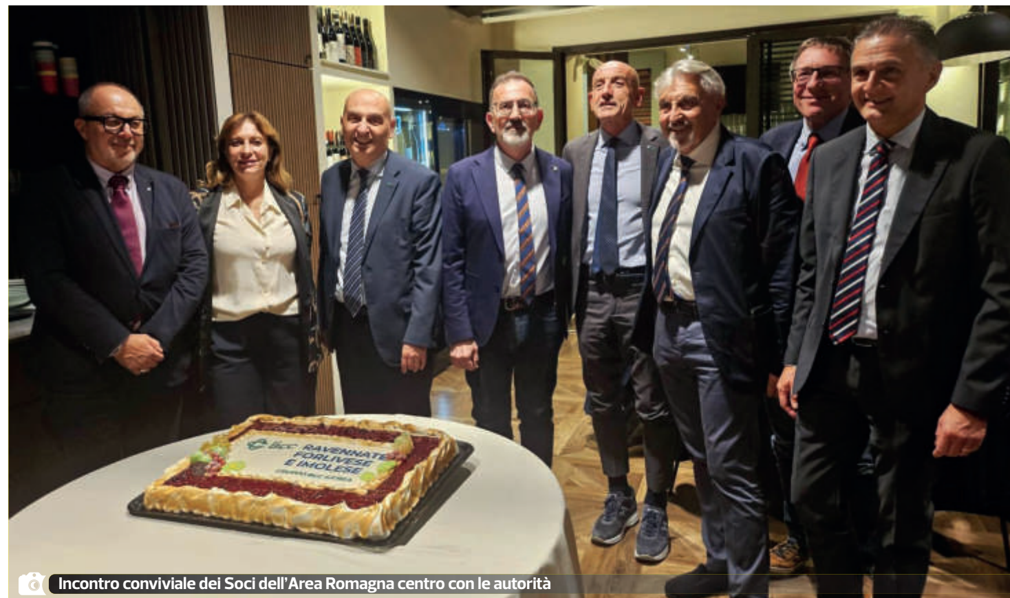
Incontro conviviale dei Soci dell'Area Romagna centro con le autorità

Ricordiamo, inoltre, tutte le numerose iniziative che la BCC sostiene sul versante della cultura, come le