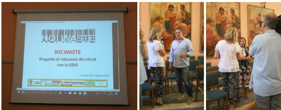
Immagini e della giornata di presentazione del Progetto NOWASTE GDO alla stampa. 29 giugno 2018