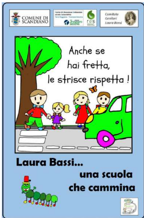
Giornata inaugurativa dei cartelli stradali.