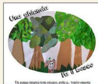
Un bosco cresce con acqua, sole e... fatto umano Sezione 5 anni Lupetti gialli, Scuola dell'Infanzia San Giuseppe