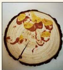
Spazio Bimbi «TUTTI GIU' PER TERRA»