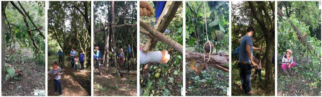
Gruppo 7-12 anni