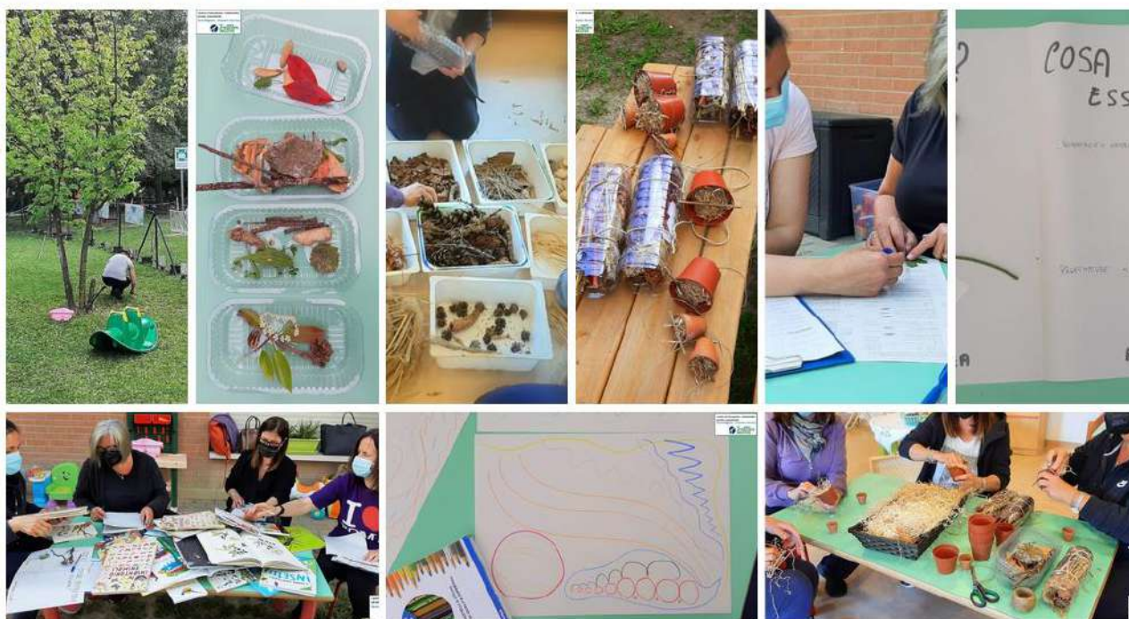
Formazione Scuola dell'infanzia "Orizzonti" dell'I.C. di Casalgrande