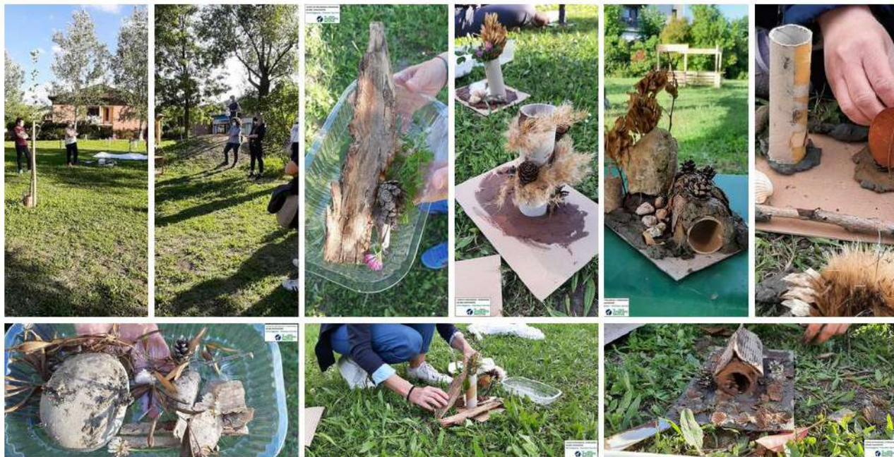
Incontro presso la Scuola dell'infanzia «Giardino della fantasia» di Castellarano