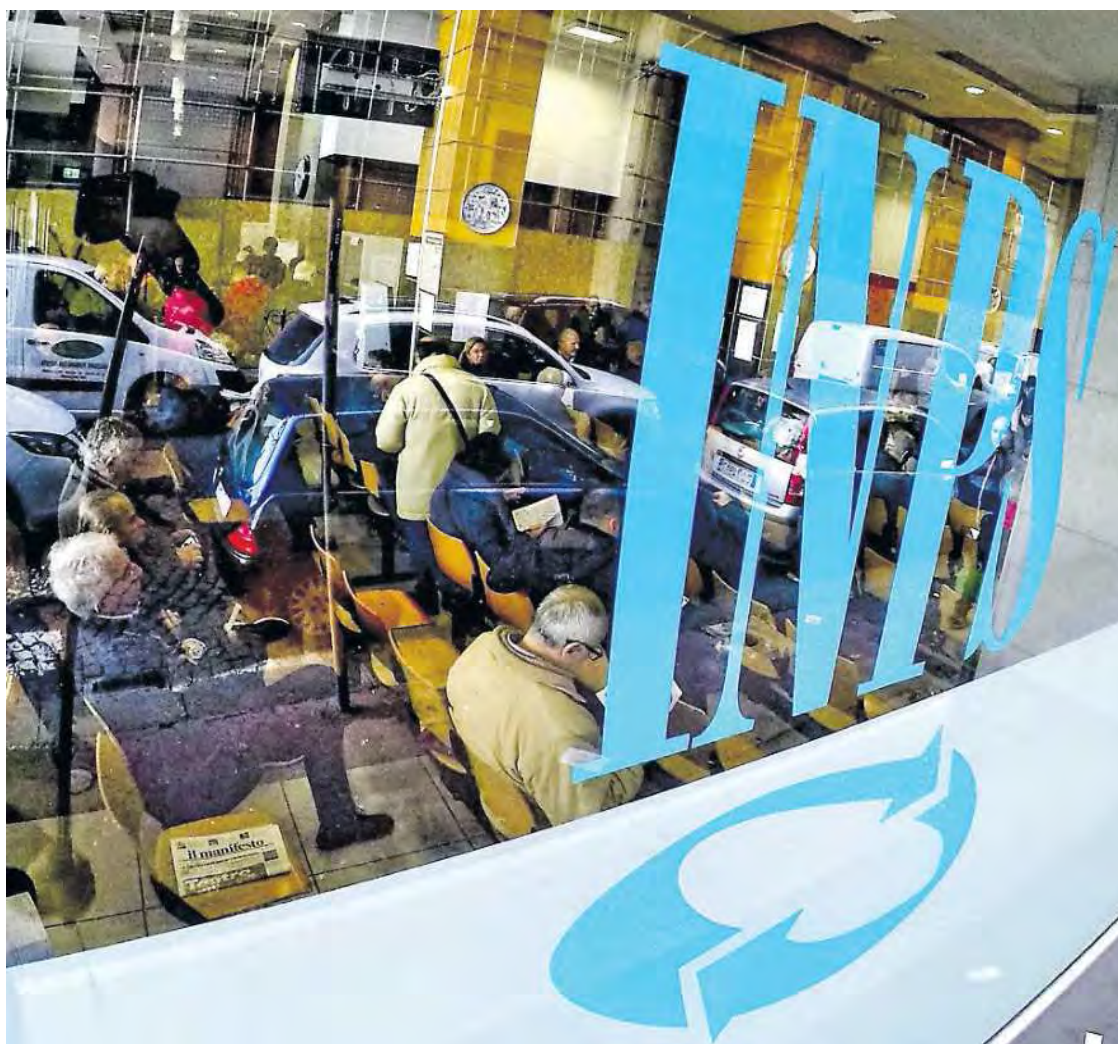
Folla in uno degli sportelli dell'Inps a Napoli

► Meloni: «L'emendamento sarà cambiato». La frenata di Lega e FI Si negozia sulla nuova finestra che allunga di tre mesi l'uscita dal 2035