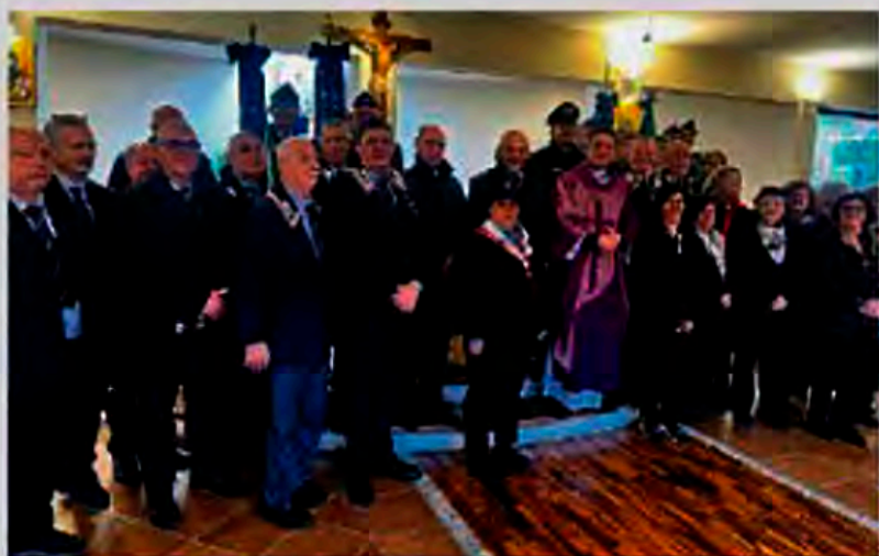
Un momento della cerimonia