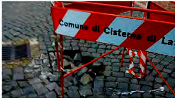
La buca in via Orsini, Cisterna Vecchia

l'acqua piovana, siamo tornati dai vigili... e ancora niente», racconta un cittadino, esasperato dalla lentezza degli interventi. Il disagio non è solo teorico: via Orsini ospita numerosi anziani, alcuni con problemi di deambulazione, e la chiusura del vicolo ha reso difficili anche le piccole attività quotidiane. La zona, come già evidenziato nelle prime cronache, è caratterizzata da un sottosuolo complesso, con antiche grotte e cunicoli risalenti a secoli fa, molte delle quali ormai crollate o chiuse. Le cosiddette "sacche vuote" aumentano il rischio di cedimenti improvvisi, rendendo la pavimentazione instabile