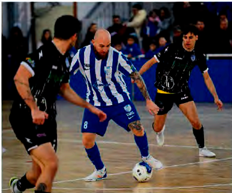
Le immagini della gara vinta a Formia dal Cisterna calcio a 5. In vetta Formia e Cisterna sono appaite a 15 punti

Partenza a razzo del Cisterna, che sorprende immediatamente i