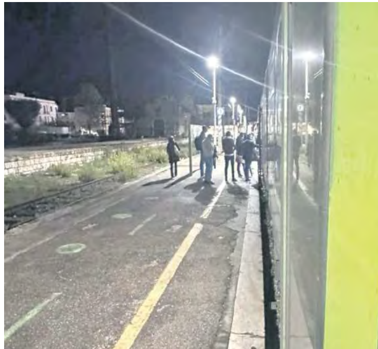
Il treno rimasto bloccato

La realtà era più semplice anche se ugualmente drammatica. Era accaduto infatti che una donna di dietro da Roma con i due nipotini arrivata alla stazione di Campoleone, al momento di scendere per via della ressa ha perso la mano di uno dei due piccolini. È stato un attimo. La donna si è voltata ma ha visto solo la porta del treno regionale che si richiudeva e la faccia del bambino al di là del vetro. Ha iniziato a urlare, ma il convoglio ormai era ripartito.