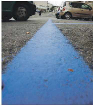
Strisce blu, la posizione della minoranza

«Una maggioranza poco attenta ai reali bisogni della cittadinanza – attaccano – ha respinto emendamenti che rappresentavano un'opportunità concreta per sostenere le fasce più esposte e promuovere una