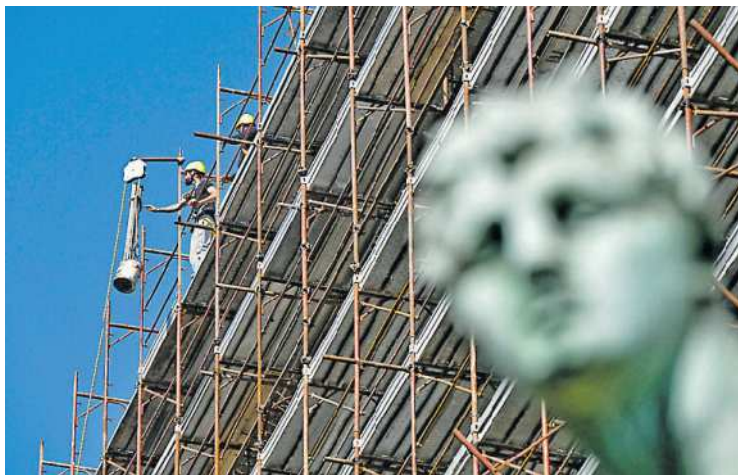
Le impalcature di un immobile in ristrutturazione

sono gli alloggi a prezzo calmierato che i privati dovranno garantire ogni 100