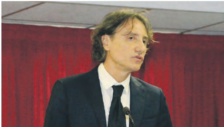
Il nuovo Procuratore capo della Repubblica di Latina, Gregorio Capasso