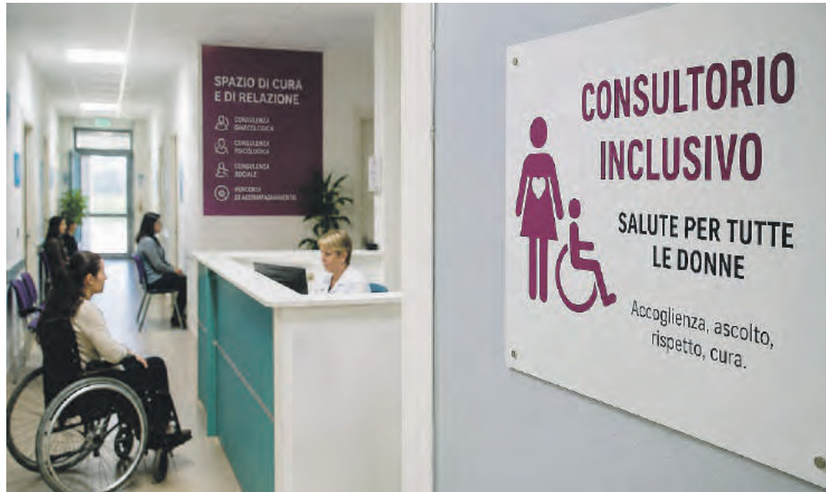
Sopra un consultorio, sotto l'assessore regionale alle politiche sociali, Massimiliano Maselli

Il progetto nasce dalla consapevolezza che la disabilità, soprattutto quando si accompagna a condizioni economiche, sociali o familiari difficili, può trasformarsi in un ostacolo ulteriore nell'accesso ai servizi sanitari. Per questo la Regione intende promuovere un modello capace di mettere al centro la persona, costruendo percorsi assistenziali personalizzati e multidisciplinari.