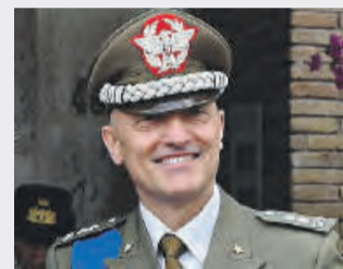
● Fabrizio Argiolas generale Esercito