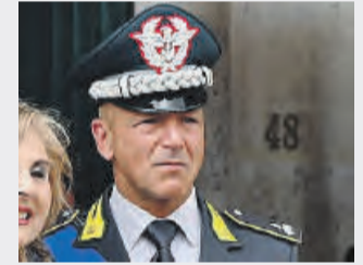
● Cristino Alemanno Capo di stato Maggiore c. aeronavale