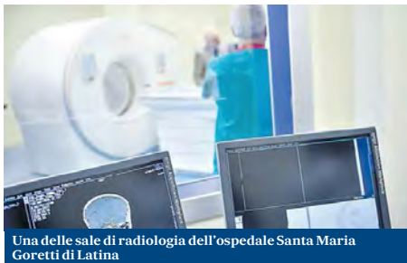
Una delle sale di radiologia dell'ospedale Santa Maria Goretti di Latina

Le risonanze magnetiche rappresentano un altro capitolo de-