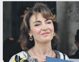
● Annarosa Rumolo archivi notariili