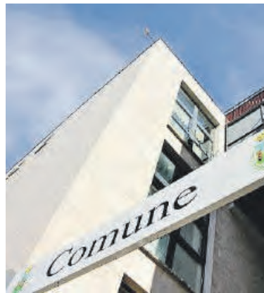
Il Comune di Cisterna

L'amministrazione comunale ha reso noto che tutte le informazioni relative ai requisiti richiesti, alle modalità di partecipazione e alla documentazione necessaria sono disponibili nell'avviso pubblicato dal Comune di Cisterna di Latina. ●