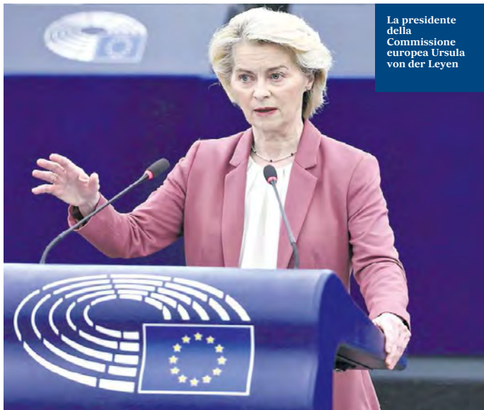
La presidente della Commissione europea Ursula von der Leyen

► La Commissione Ue pronta ad accogliere le richieste di Roma: sì alla clausola di salvaguardia entro lo 0,6% del Pil aggregato per il 2026-2028. L'utilizzo delle risorse potrà essere modulato