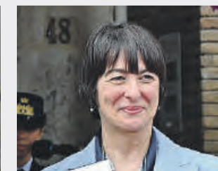
● Plautilla Calvani dirigente Ministero Interno