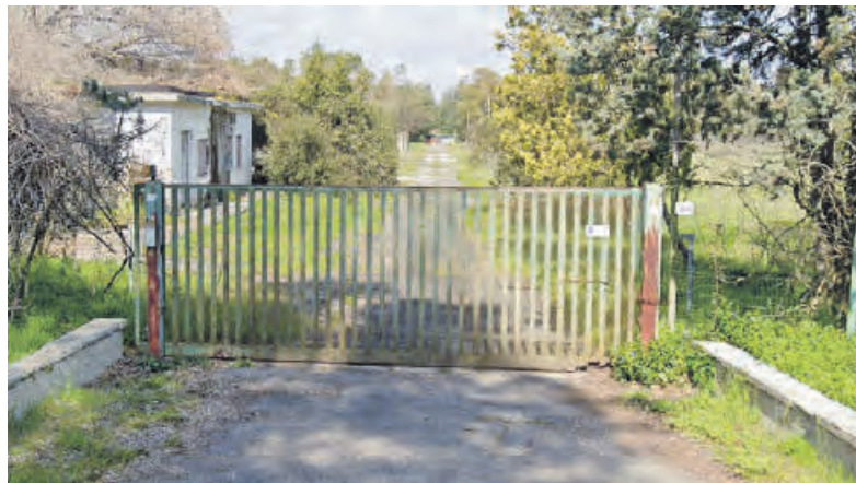
L'ingresso dell'ex polveriera

Negli anni l'ex polveriera era stata indicata come una delle principali occasioni di sviluppo del territorio, soprattutto dopo il progetto del maxi centro commerciale approvato nel 2015 dal Consiglio comunale.