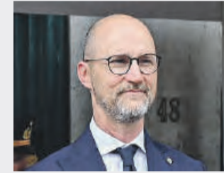
● Gianluca Piasentin colonnello Carabinieri