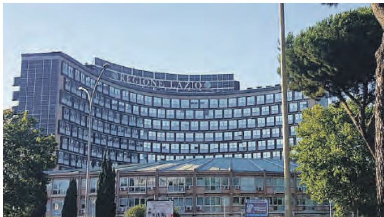
La sede della Regione Lazio

tamente cantierabili, capaci di incidere concretamente sulla vita delle comunità locali. I progetti potranno riguardare la manutenzione e la messa in sicurezza della rete viaria, la realizzazione di marciapiedi, parcheggi e piste ciclabili, ma anche la riqualificazione di piazze e spazi pubblici, il recupero di edifici scolastici, strutture culturali, impianti sportivi e servizi sociali. La misura assume una particolare rilevanza per il tessuto dei piccoli e medi Comuni laziali, che rappresentano la parte più consistente del territorio regionale. Non a caso il bando prevede una