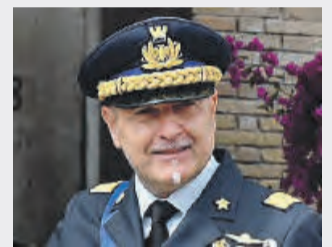
● Giacomo Ghiglierio generale Aeronautica