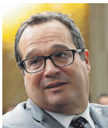
Il sottosegretario Claudio Durigon