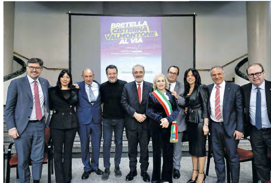
La presentazione dei bandi per la Bretella al teatro D'Annunzio. Sotto: il ministro Salvini