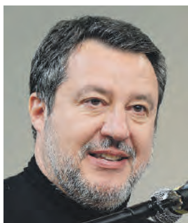
Il ministro Matteo Salvini

«UN PROGETTO QUASI MORTO CHE ABBIAMO RIMESSO IN PIEDI; UNO DEI PRIMI DOSSIER ARRIVATI SULLA MIA SCRIVANIA»