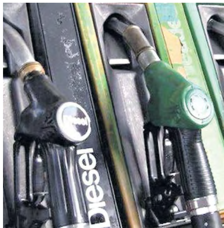
Un distributore di benzina e diesel

«Non c'è stato nessun aumento ingiustificato - si difende l'Unem, l'associazione che rappresenta i petroliferi italiani - e ad amplificare i rincari sono anche accise e Iva. È comunque evidente che se la tendenza rialzista dei mercati continuerà si vedranno nuovi rincari. Ma va ricordato che eravamo ai livelli di prezzo più bassi degli ultimi tre anni e che tra diversi distributori ci possono essere differenze di costo anche di 10-15 centesimi». L'associazione dei consumatori Adoc parla invece di «speculazioni» da parte dei petroliferi, visto che «il Paese dispone di riserve stoccate che dovrebbero ammortizzare queste oscillazioni di mercato, che auspicabilmente potrebbero rientrare». D'accordo anche Assou-