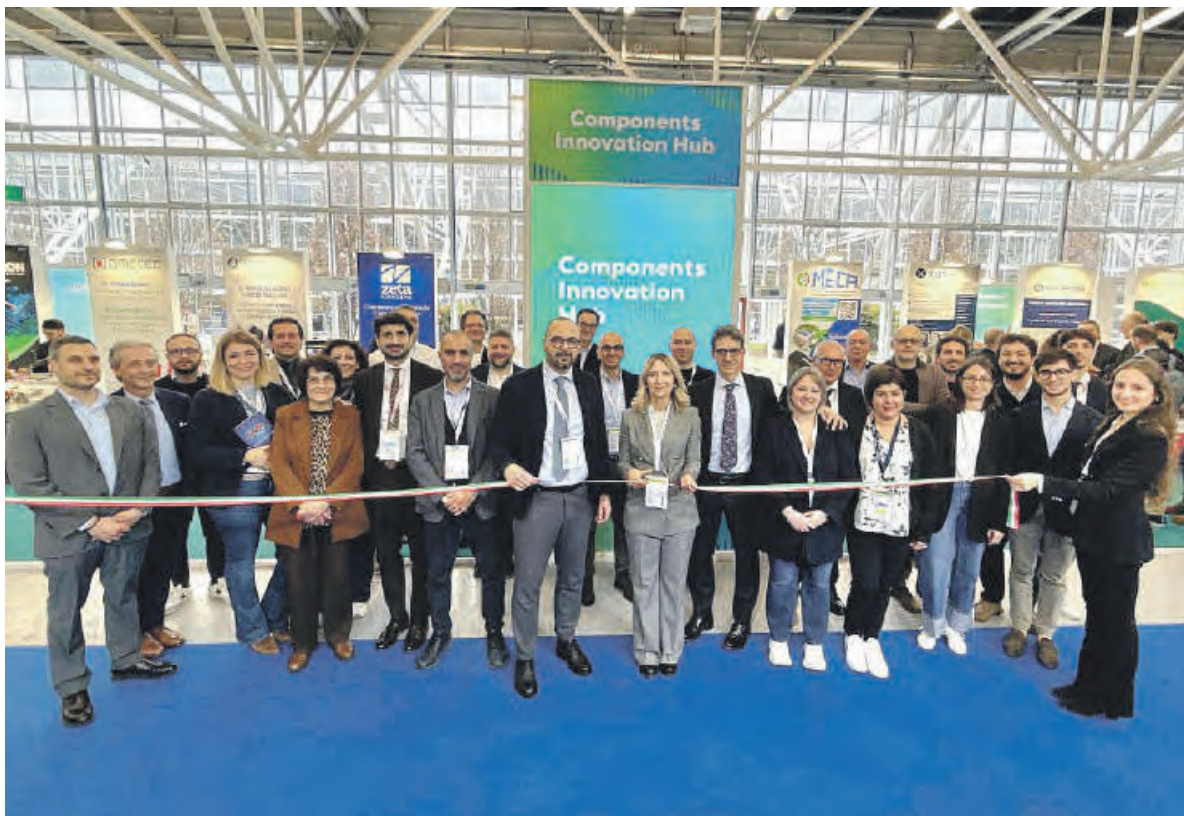
Il taglio del nastro della ventiquattresima edizione della fiera bolognese "MECSPE – Tecnologie per l'innovazione"

EVENTO STRATEGICO PER IL SISTEMA PRODUTTIVO DI TUTTO IL BASSO LAZIO