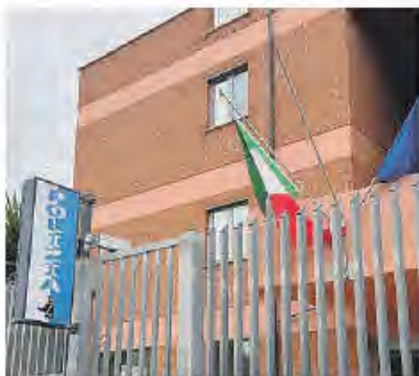
Il Commissariato di Cisterna

Per mesi avrebbe minacciato, intimidito e aggredito la compagna fino all'ultimo episodio di violenza, culminato – secondo quanto ricostruito dagli investigatori – in un'aggressione fisica che ha costretto la donna a ricorrere alle cure mediche. Per questo un uomo residente a Cisterna è stato raggiunto da una misura cautelare eseguita dagli agenti del Commissariato di Polizia: dovrà lasciare la casa familiare e non potrà avvicinarsi alla persona offesa né ai luoghi da lei frequentati. Per lui è stato disposto anche il braccialetto elettronico. Il provvedimento è stato emesso dal giudice per le indagini preliminari del tribunale di Latina su richiesta della Procura, al termine dell'attività investigativa con-