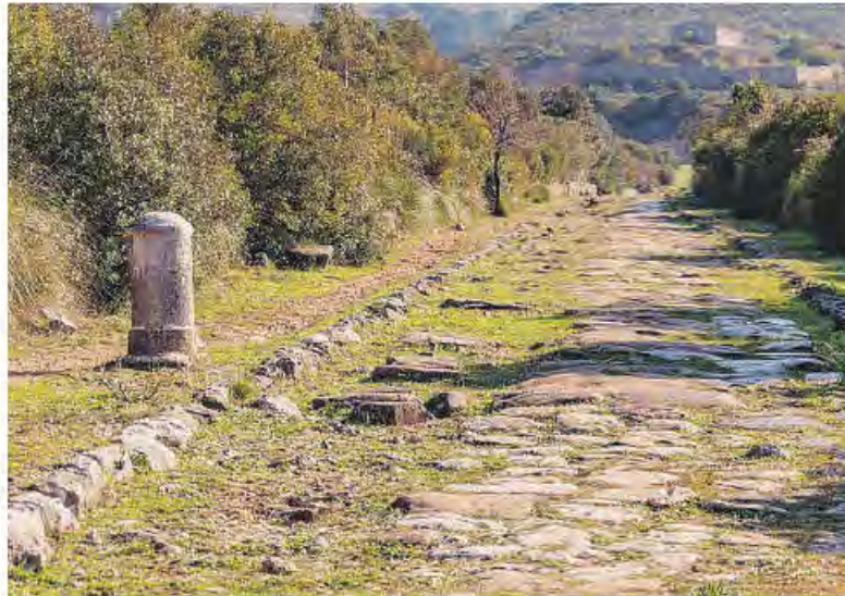
Un tratto della via Appia

Spazio anche all'ambiente con l'uscita in canoa sul fiume Cavata organizzata a Sorgenti Alte in occasione della Giornata mondiale