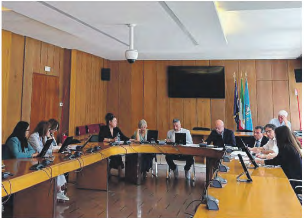
Un momento della commissione Lavoro alla Pisana

IL PROVVEDIMENTO CHE ACCELERA LE TUTELE APPROVATO ALL'UNANIMITÀ, PROSEGUE ORA L'ITER VERSO L'AULA