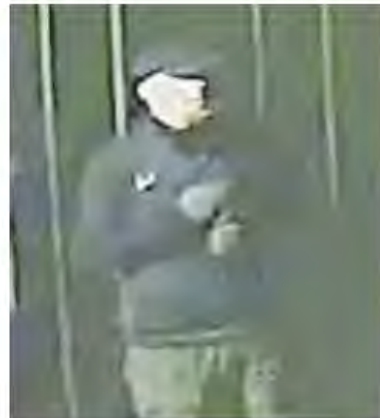
Uno dei ladri ripreso dalle telecamere