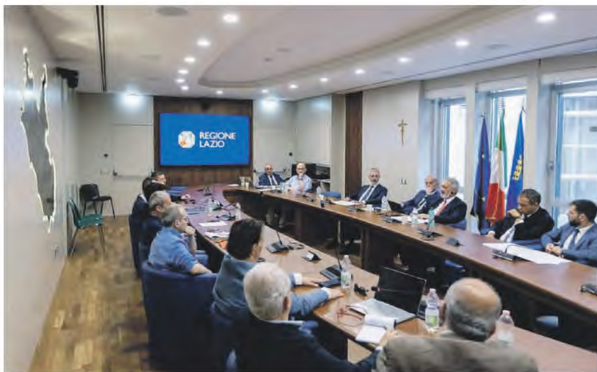
Un momento dell'incontro alla Regione Lazio con i sindacati

L'amministrazione regionale ha sottolineato come il Lazio sia stata la prima e unica Regione italiana ad anticipare l'entrata in vigore delle misure di prevenzione rispetto alla prima giornata classificata con "bollino rosso" per il rischio caldo. Una scelta che punta a intervenire in modo preventivo per ridurre i ri-