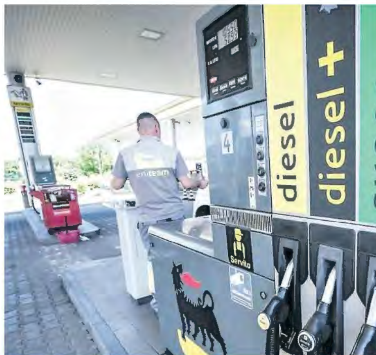
Un distributore di carburanti

Lo ha fatto ieri il ministro dei Trasporti e vicepremier, Matteo Salvini, tirando in ballo, citandolo per nome, sia Unicredit sia Intesa Sanpaolo. Un'uscita accolta in Borsa con una sbandata dei titoli, poi in parte rientrata. A fine seduta le due banche hanno chiuso in rosso: -1,38% per il gruppo guidato da Andrea Orcel e -0,30% per quello guidato da Carlo Messina. Un'idea dell'orizzonte temporale del nuovo intervento è stata fornita dal ministro degli Esteri, Antonio Tajani: «Il governo sta valutando di prolungare fino a fine giugno i provvedimenti adottati; il problema del caro energia, però, non è legato solo all'emergenza, è un problema molto contingente, ma anche complessivo, perciò chiediamo il mercato unico europeo dell'energia». Il decreto ministe-