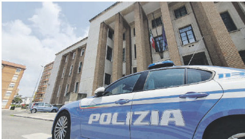
Il Tribunale di Latina e in primo piano una volante della Polizia