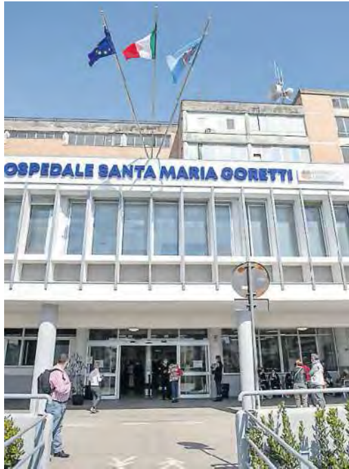
L'ospedale Santa Maria Goretti

►Impossibile trasferire i reparti più delicati verrà realizzato un "esoscheletro" esterno