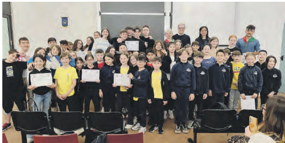
Gli alunni premiati nella quarta edizione del concorso multimediale “Martiri di Pratolungo”

I giovani partecipanti hanno realizzato elaborati multimediali valutati da una commissione composta da esperti del mondo della scuola, della cultura e dell’associazionismo. Un percorso educativo che