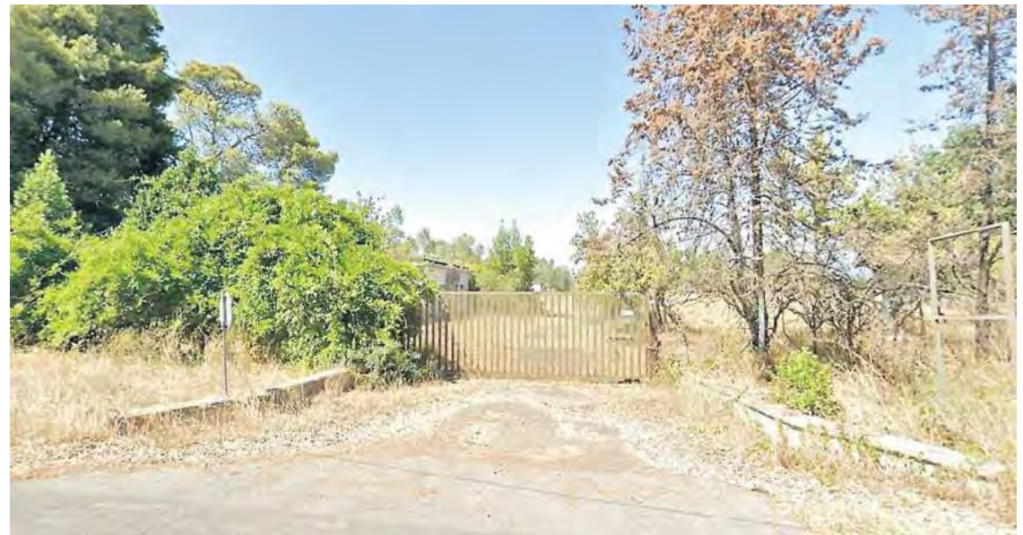
L'ingresso all'ex polveriera di Cisterna in via Piano Rosso a ridosso della Pontina