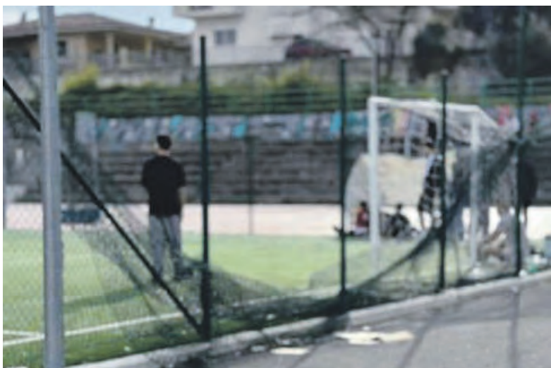
La rete divelta nell'area sportiva dedicata a Moses Kamara

— C'è un confine sottile tra riqualificazione e abbandono, e nel quartiere Sciangai quel confine sembra essere stato nuovamente superato. I campetti sportivi inaugurati poco meno di due anni fa sono oggi ostaggio di raid vandalici che si consumano soprattutto nelle ore notturne, quando l'area resta chiusa e qualcuno decide di scavalcare le recinzioni per entrare. All'inizio erano i segni, purtroppo ormai consueti, dei bivacchi: lattine vuote, bottiglie di birra, rifiuti lasciati a terra. Poi il salto di qualità, in negativo. Una panchina danneggiata, fino ad arrivare alle reti di protezione completamente divelte. Strutture piegate, strappate, pericolose anche per chi, il giorno dopo, vorrebbe semplicemente utilizzare gli spazi per fare sport. Un'escalation che racconta più di un semplice episodio di inciviltà. Racconta di un'area che, nelle ore serali, sfugge a qualsiasi forma di controllo e diventa terreno fertile per atti vandalici che rischiano di compromettere un investimento importante per il quartiere. Eppure, solo nel luglio del 2024, quei campetti erano stati restituiti alla città come simbolo di rinascita. Dopo anni di degrado, l'area accanto alla scuola Plinio