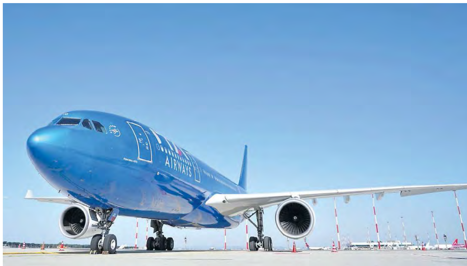
Un volo in attesa del decollo all'aeroporto Leonardo da Vinci di Roma

►Gli aeroporti scrivono alla Commissione Ue: «Senza lo sblocco, saremo in crisi» Raddoppiato il prezzo del jet fuel: aumenti per le tariffe aeree e tagli alle rotte