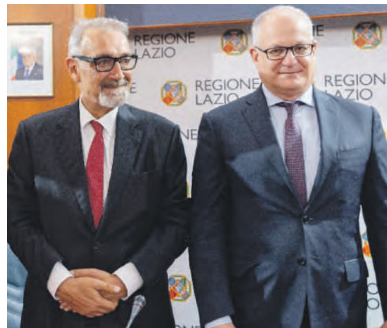
Il presidente della Regione Francesco Rocca e il sindaco di Roma Roberto Gualtieri