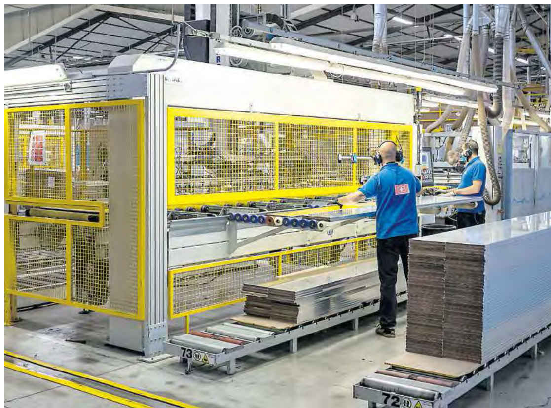
Lavoratori impegnati alla catena di montaggio

► Con il decreto Primo maggio si vuole rendere strutturale la decontribuzione per gli assunti La Cisl: retribuzioni su del 3,1%, con i contratti di secondo livello ripresi 5 punti di inflazione