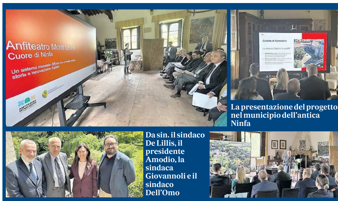
La presentazione del progetto nel municipio dell'antica Ninfa