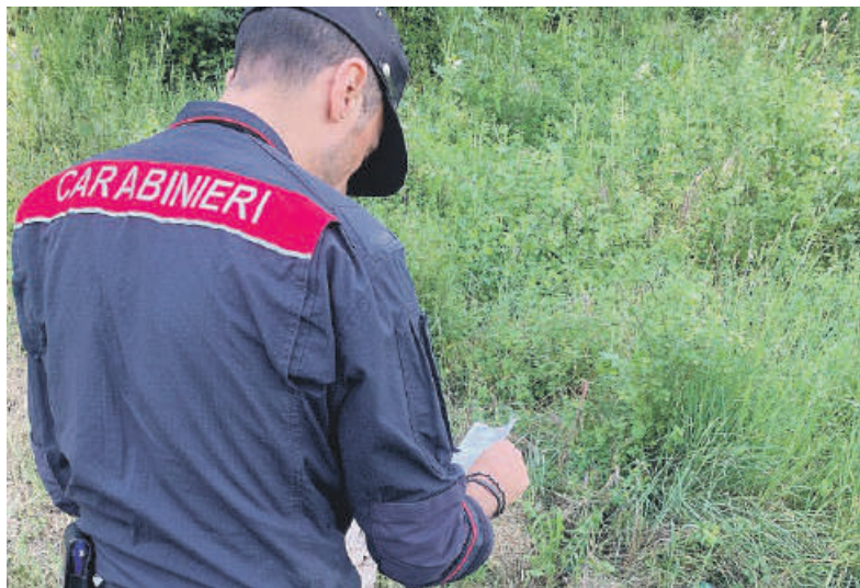
Una delle tracce trovate dal nucleo Forestale e che ha portato alla denuncia di 4 persone

NELLE SCORSE SETTIMANE ALCUNI RESIDENTI DELL'AREA PERIFERICA AVEVANO SEGNALATO DIVERSE DISCARICHE