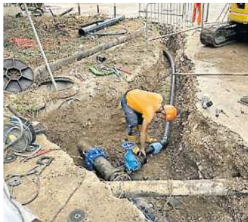
Un precedente intervento di Acqualatina a Cisterna

Domani gran parte del territorio comunale di Cisterna resterà senza acqua per consentire ad Acqualatina di eseguire un nuovo intervento sulla rete idrica. L'interruzione del flusso è prevista dalle 14 alle 17 e interesserà praticamente tutto il comune, ad eccezione delle zone di Le Castella e San Valentino, che non saranno coinvolte dai lavori. L'intervento rientra nel progetto