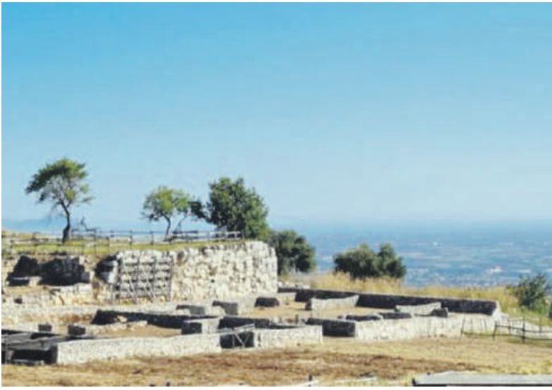
Da sinistra: il sito dell'antica Norba, il museo di Cori e il castello Caetani di Sermoneta