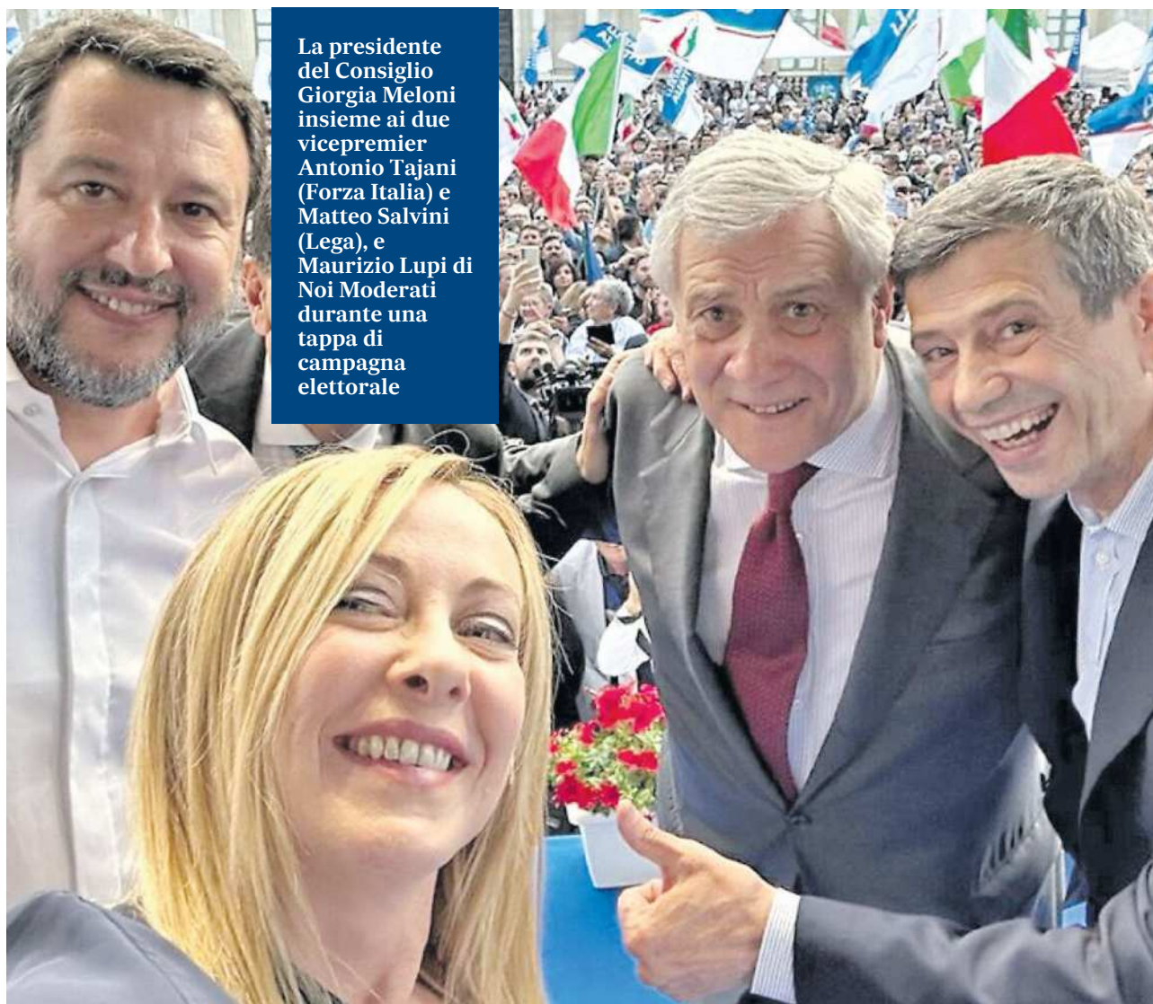
La presidente del Consiglio Giorgia Meloni insieme ai due vicepremier Antonio Tajani (Forza Italia) e Matteo Salvini (Lega), e Maurizio Lupi di Noi Moderati durante una tappa di campagna elettorale

► Riunione tra Meloni e i leader (Tajani, Salvini, Lupi): avanti sul premio di maggioranza alla coalizione che vince le elezioni. Il tentativo di "stanare" le opposizioni: «Vediamo se vogliono la stabilità del Paese»