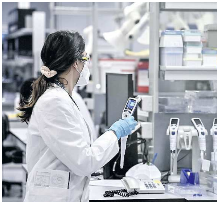
Il laboratorio di una azienda farmaceutica nel Lazio