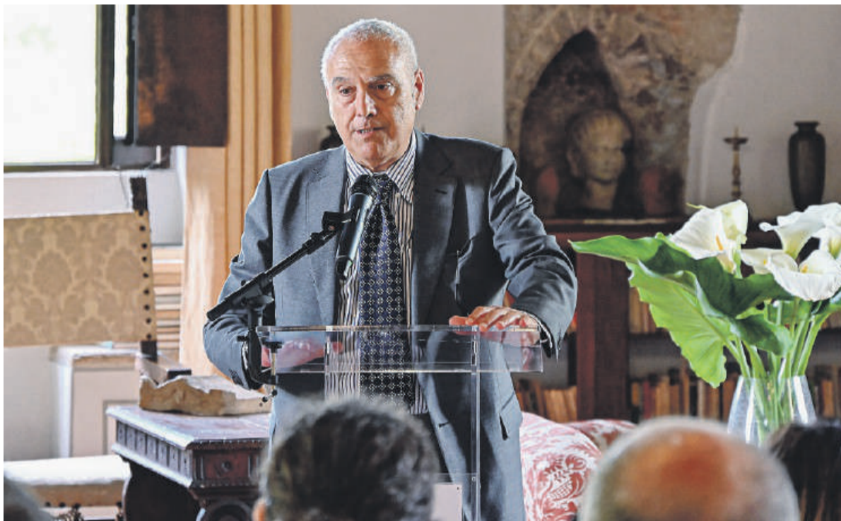
Alcuni momenti della presentazione di ieri.

L'idea di fondo è quella di superare il concetto tradizionale di mu-