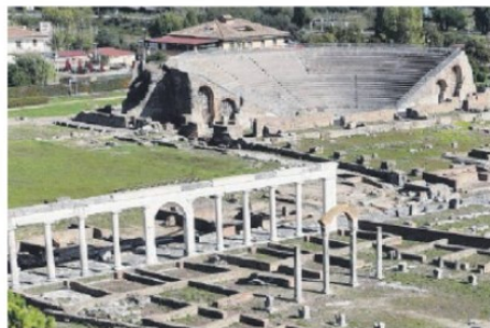
Alcuni scorsi della via Appia, patrimonio Unesco