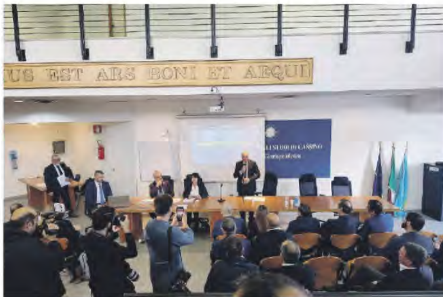
Un momento dell'incontro di ieri mattina all'Università

Presentati anche gli interventi per la semplificazione amministrativa e il rafforzamento della competitività territoriale, tra cui l'apertura dello Sportello Unico per le imprese del Consorzio In-