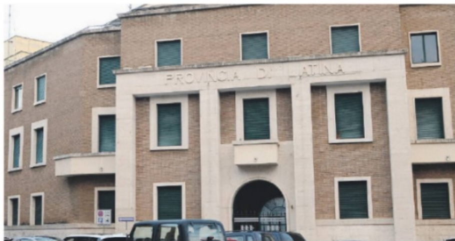
La sede della Provincia di Latina in via Costa

A spiegare il significato politico della scelta è stato il segretario pro-