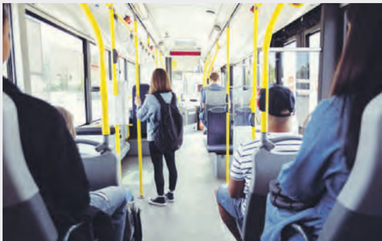
Alcuni passeggeri su un bus