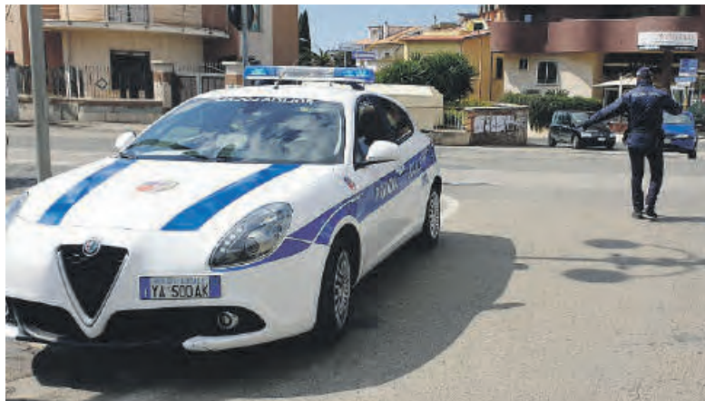
Un posto di controllo della Polizia Locale di Cisterna

delle attività di vigilanza sul territorio. Alla richiesta di fermarsi avrebbe però reagito accelerando bruscamente nel tentativo di evitare gli accertamenti. Ne sarebbe nato un breve inseguimento durante il quale il conducente avrebbe proseguito la marcia mantenendo una condotta di guida giudicata pericolosa, mettendo a rischio la propria incolumità e quella degli altri utenti della strada. Grazie all'intervento di una seconda pattuglia il veicolo è stato bloccato e il conducente identificato. Dagli immediati controlli è emerso che il ragazzo non aveva mai conseguito la patente di guida. Inoltre l'auto sulla quale viaggiava è ri-