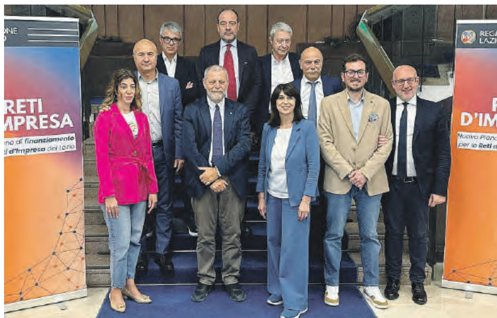
Un momento a margine della presentazione di ieri

IERI MATTINA LA PRESENTAZIONE L'OBIETTIVO: CREARE RETI D'IMPRESA DURATURE