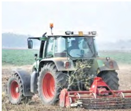
I rincari dei fertilizzanti (+85%) e del carburante per i trattori pesano in misura consistente sulla produzione agricola

Sullo stop ai dazi sui fertilizzanti le valutazioni delle organizzazioni agricole non sono dello stesso tenore. Non sono soddisfatte Coldiretti e Filiera Italia che ritengono la misura inadeguata senza lo stop al Cbam, il dazio ambientale introdotto dalla Ue. Coldiretti chiede un passo indietro sul meccanismo di adeguamento del carbonio alle frontiere e sull'Ets. Inoltre, per le due organizzazioni, bisogna liberalizzare l'impe-