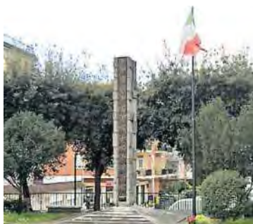
Monumento ai caduti di Aprilia

Infine, a Sermoneta, il programma prevede il raduno alle ore 9.30 a Fuoriporta, seguito alle 9.45 dal corteo verso il monumento ai caduti, dove sarà deposta la tradizionale corona d'alloro.