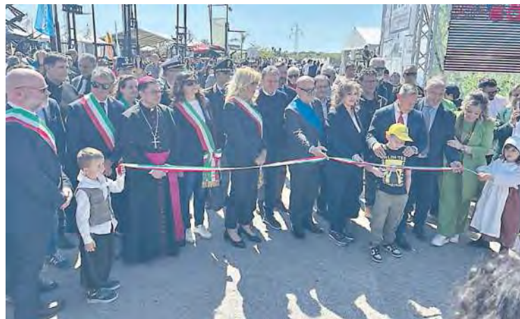
Il taglio del nastro della Mostra Agricola Campoverde