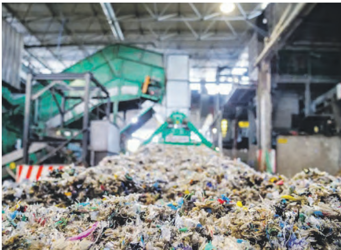
L'impianto di Rocca Cencia