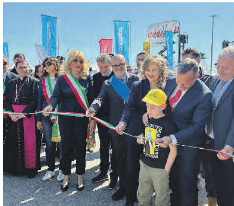
Il taglio del nastro della Fiera Agricola di Campoverde