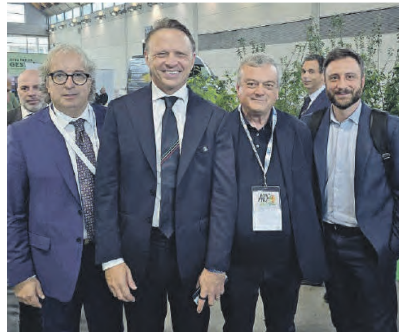
Anbi Lazio protagonista alla fiera "Macfrut" di Rimini