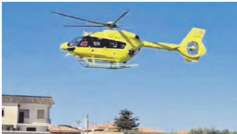
L'eliambulanza in via Montellanico (fotoda Stai a Cisterna)

mediato a Roma per accertamenti e cure specialistiche. Sul posto, il personale sanitario ha operato con rapidità e precisione, stabilizzando il piccolo e predisponendo il trasferimento in elicottero.