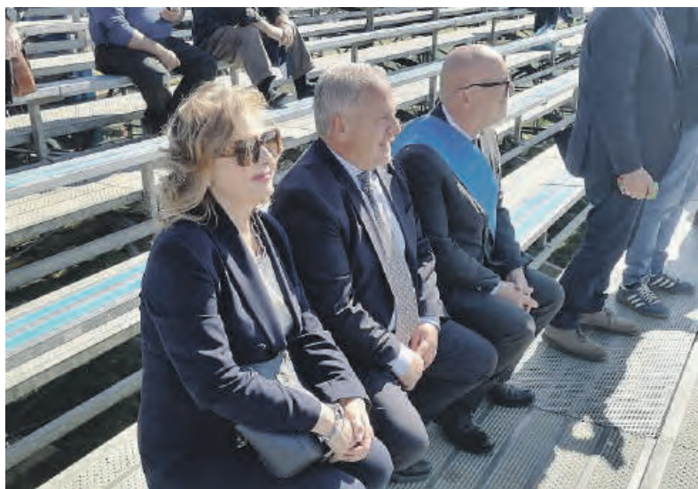
Alcune immagini della prima giornata di ieri con la Mostra Agricola di Campoverde