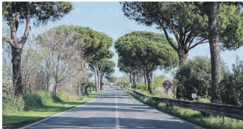
Una immagine della Via Appia

Cammino odv ha lavorato sul "Viaggio lungo l'Appia" raccontato da Orazio nelle Satire, e avvenuto nel 37 a.C. Con un testo trasformato successivamente in sceneggiatura. Orazio parte da Roma, Porta Capena, e percorrendo a piedi la Regina Viarum ce ne dà una testimonianza autentica. Questa mattina la Compa-