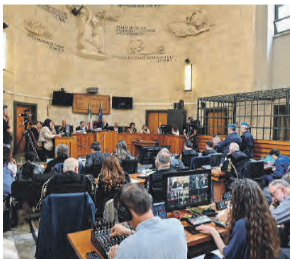
Sopra l'accesso dei Carabinieri dove sono avvenuti i fatti contestati sotto l'aula della Corte d'Assise dove si sta celebrando il processo per l'omicidio