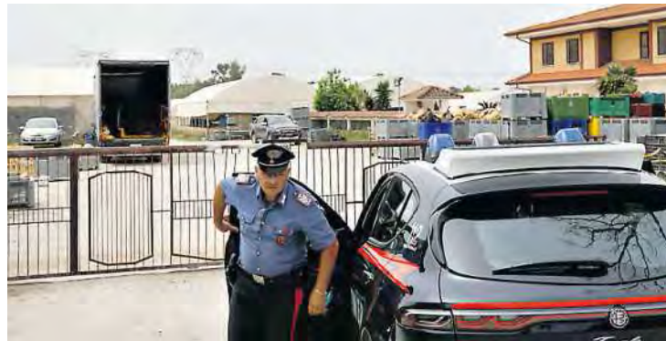
I carabinieri davanti all'azienda Lovato