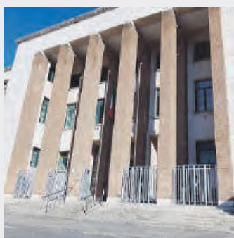
Il Tribunale di Latina