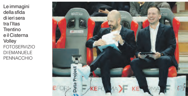
Le immagini della sfida di ieri sera tra l'Itas Trentino e il Cisterna Volley.