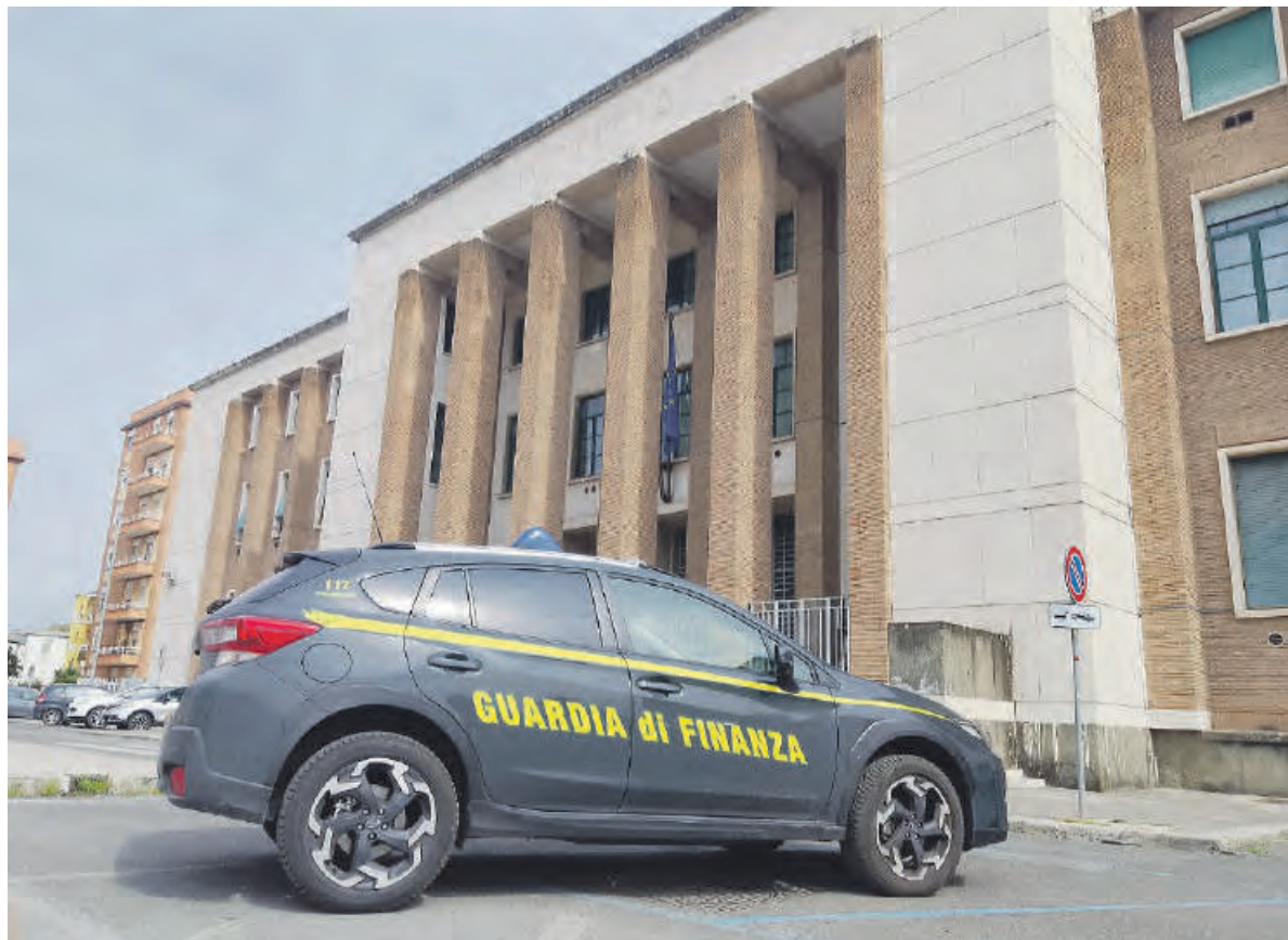
Le indagini condotte dalla Guardia di Finanza del Nucleo di Polizia Economico Finanziaria

NEI GIORNI SCORSI I FINANZIERI HANNO NOTIFICATO L'ORDINANZA CAUTELARE