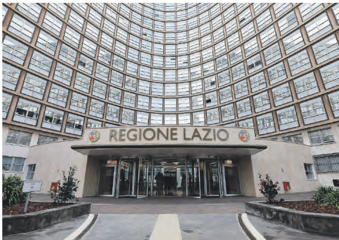
La sede della Regione Lazio