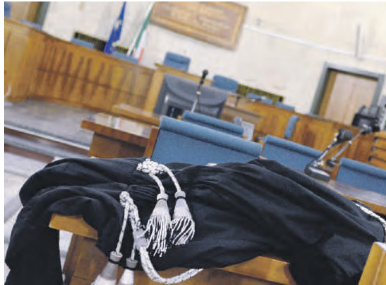
Il Tribunale di Latina

Un volo nel vuoto da otto metri, le gravi ferite e ora il processo. Dovranno rispondere di lesioni colpose aggravate e violazioni della normativa sulla sicurezza sul lavoro due uomini, A.G. di 65 anni e A.D.G. di 37 anni, finiti a giudizio per l'incidente avvenuto nell'ottobre del 2022 all'interno di un capannone industriale lungo la via Appia, a Cisterna, dove è rimasto gravemente ferito l'operaio F.D.M. Quest'ultimo era impegnato nella sostituzione delle lastre di copertura in fibrocemento in un capannone sull'Appia sud a Cisterna e precipitò al suolo durante le lavorazioni. A processo sono finiti il datore di lavoro e amministratore unico della società esecutrice dei lavori, insieme al preposto di cantiere, entrambi accusati, a vario titolo, di aver operato in violazione delle norme previste dal decreto legislativo 81 del 2008. Secondo l'impostazione accusatoria, alla base dell'infortunio ci sarebbe stata una gestione carente sotto il profilo della sicurezza. In particolare, al datore di lavoro viene contestato di non aver effettuato una adeguata valutazione dei rischi presenti nel cantiere, soprattutto quelli legati ai lavori in quota, e di non aver predisposto le necessarie misure di prevenzione e protezione. Non solo. L'operaio, stando agli atti, non sarebbe stato dotato di dispositivi idonei a evitare la caduta dall'alto, mentre le attrezza-