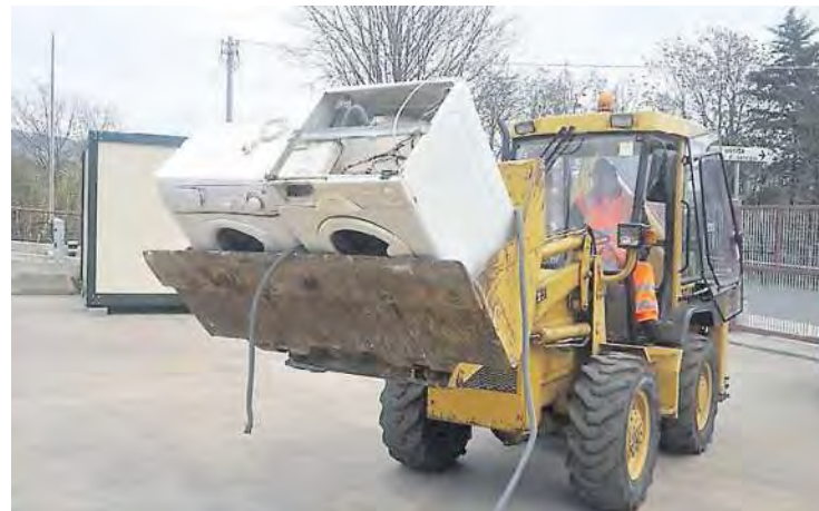
Lavatrici destinate allo smaltimento secondo le procedure previste per i rifiuti speciali

In totale nel Lazio è stata registrata una crescita media del 6,9%, per un totale complessivo di 32.682 tonnellate di rifiuti RAEE raccolte. Come da norma, una buona raccolta corrisponde allo stesso tempo a dei premi di efficienza, che hanno conferito 2.688.801 euro ai re-