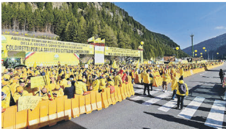
Coldiretti Lazio tra i diecimila presenti alla mobilitazione

di energia, carburanti e fertilizzanti, rendendo più difficile anche l'approvvigionamento e mettendo a rischio semine e raccolti. Uno scenario che apre la strada anche a una maggiore diffusione di alimenti ultra-trasformati, con ricadute su qualità e trasparenza.