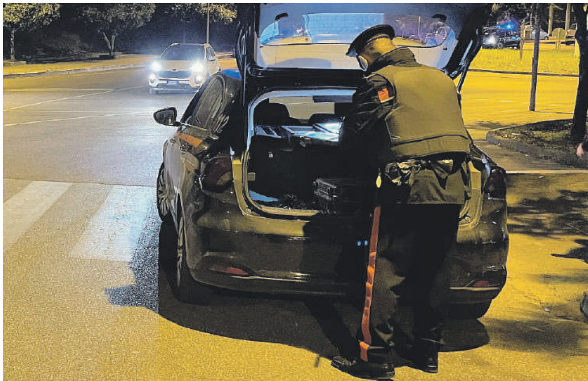
I Carabinieri di Cisterna

Nei guai un 20enne che è stato denunciato dai Carabinieri