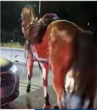
Uno dei cavalli sfiorato da un'auto in uno dei semafori della Cristoforo Colombo

ROMA Una scena da film: un branco di cavalli imbizzarriti che galoppo in mezzo alla Cristoforo Colombo, gli automobilisti che all'improvviso si ritrovano a fare lo slalom tra gli animali che corrono spaventati per chilometri, con gli agenti della polizia locale e alcuni militari a cavallo che li inseguono dalle Terme di Caracalla, nel centro della Capitale, fino alle strade dell'Eur. Bisogna ripartire dalla notte di venerdì, poco prima che iniziassero le prove generali in vista della parata delle Forze Armate del 2 giugno, per capire cosa è successo. È tutto pronto: 200 cavalli già allineati, mancano pochi minuti alla mezzanotte e all'improvviso una salva di fuochi d'artificio scuote il silenzio. A sparare, nella vicina via Baccelli, sarebbe stata una pattuglia della polizia locale, proprio sopra ai recinti. Uno dei vigili avrebbe ammesso le sue responsabilità, anche se le indagini sono nelle fasi iniziali.