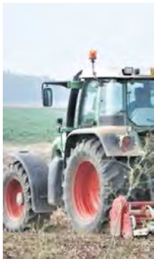
Un trattore nei campi

Ma non basta, perché il settore agricolo è in una vera e propria morsa. Il risparmio valutato da Bruxelles per lo stop di un anno sulle tariffe all'import per i fertilizzanti è di 60 milioni. In Italia l'esecutivo Meloni ha re-