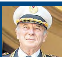
A sinistra il momento in cui alcuni vigili fanno esplodere i fuochi d'artificio. Nella foto piccola il comandante

tare altre ipotesi qualora il magistrato titolare del fascicolo lo ritenesse opportuno. A quel punto procederemo». L'agente ha ammesso di aver acceso i mortaretti senza voler fare del male ma era in servizio. Come