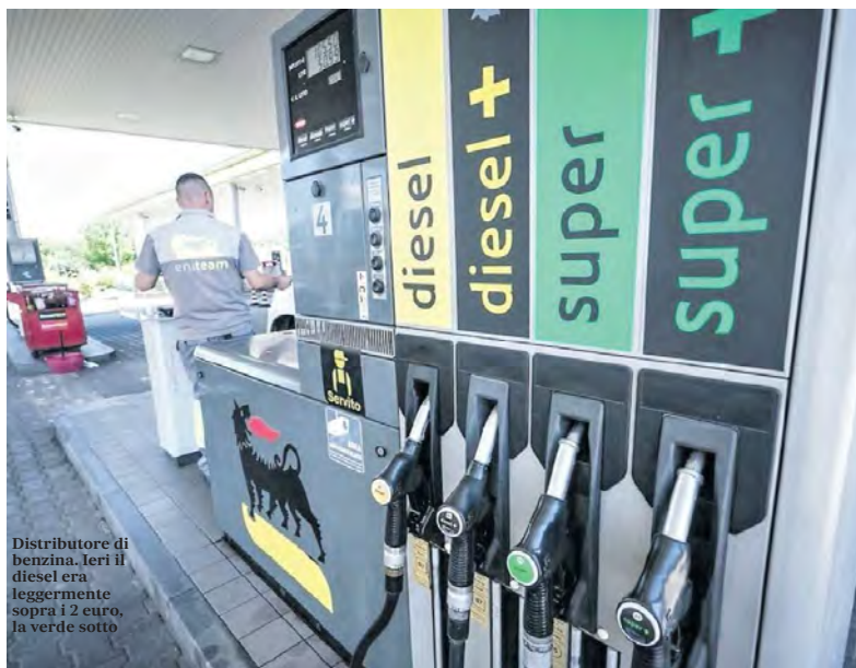
Distributore di benzina. Ieri il diesel era leggermente sopra i 2 euro, la verde sotto

In una nota congiunta i quattro organismi segnalano: «Le scorte globali di petrolio si stanno riducendo a