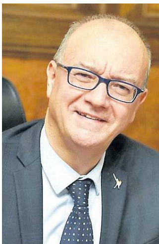
Giuseppe Valditarà ministro dell'Istruzione

BISOGNA STRONCARE QUESTA "MODA" DI ARMARSI PER ANDARE IN CLASSE. BASTA CON IL "PERDONISMO": SERVE EDUCARE E SANZIONARE