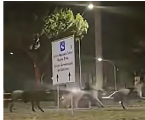
Tre momenti della corsa tra le auto lungo la Cristoforo Colombo. Tutti gli automobilisti per fortuna sono riusciti a schivare i cavalli in fuga