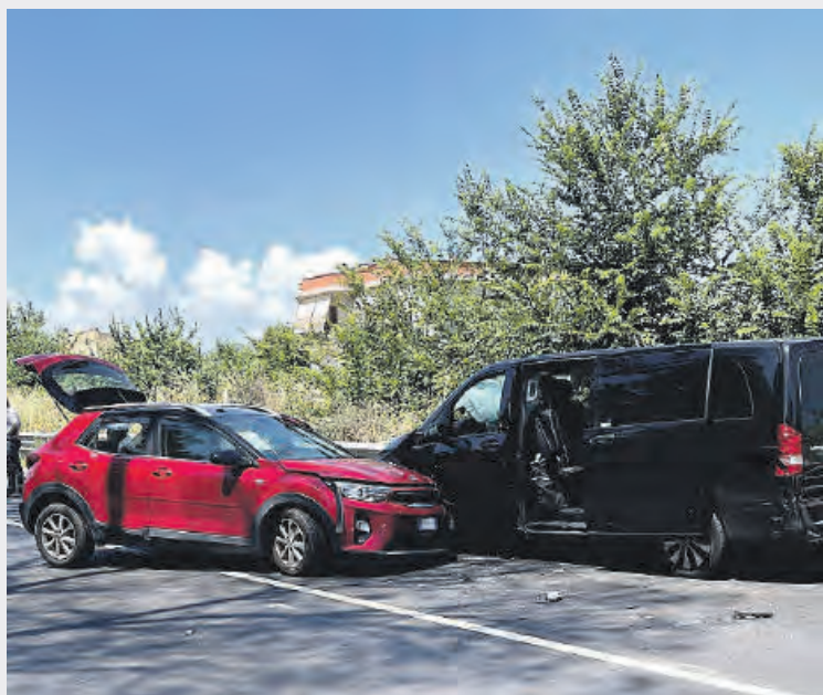
Le due vetture scontratesi ieri lungo la via Appia