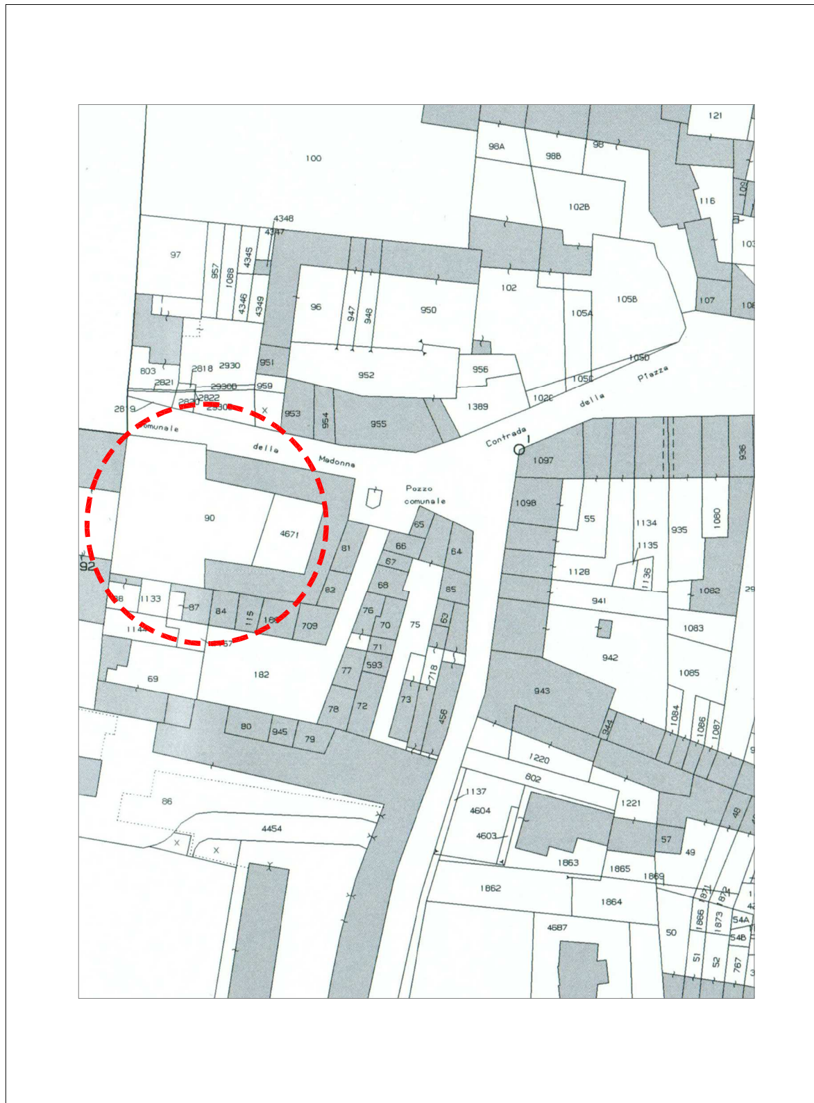
Estratto Mappa Scala 1:1000