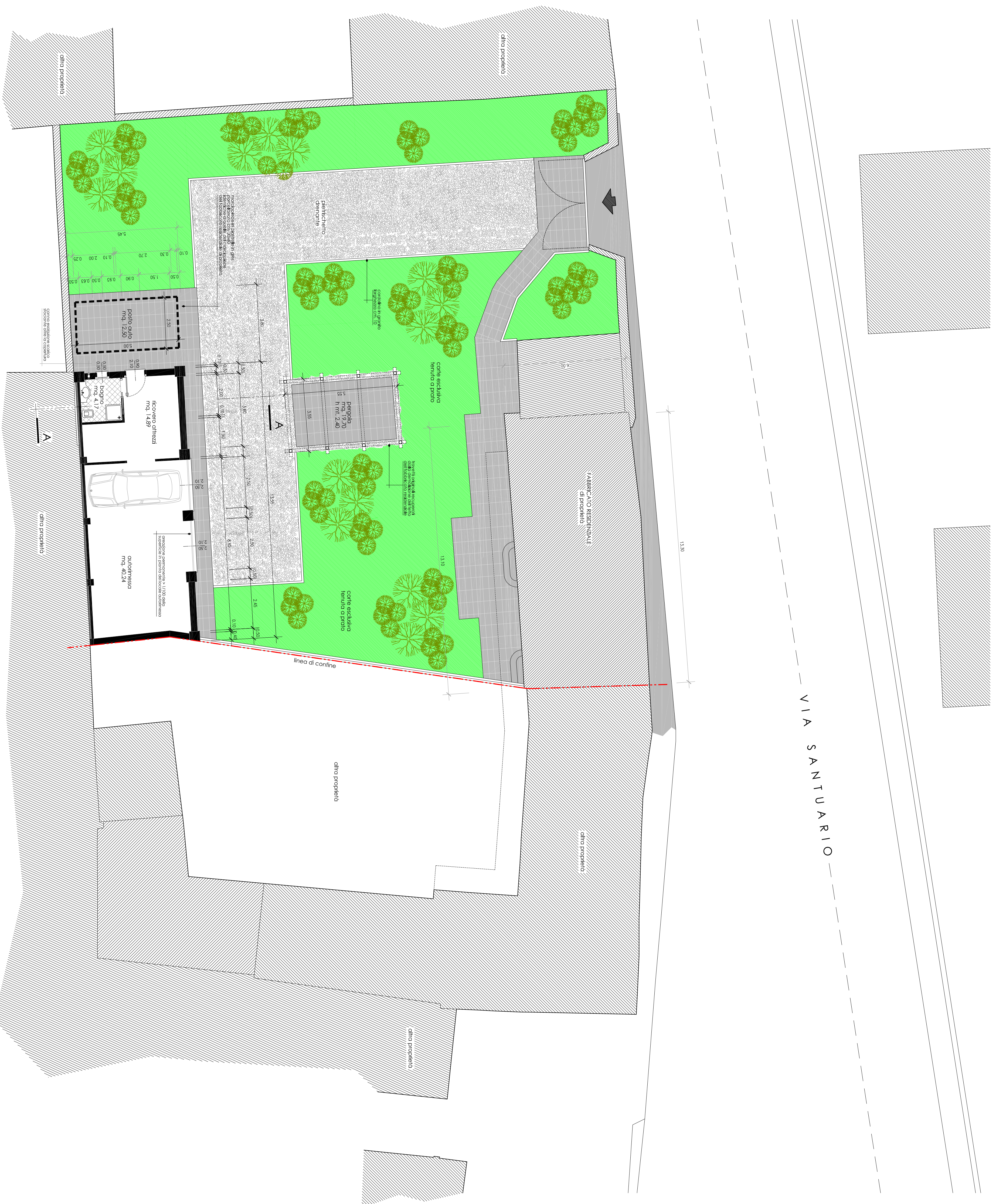
Progetto - Planimetria Piano Terra