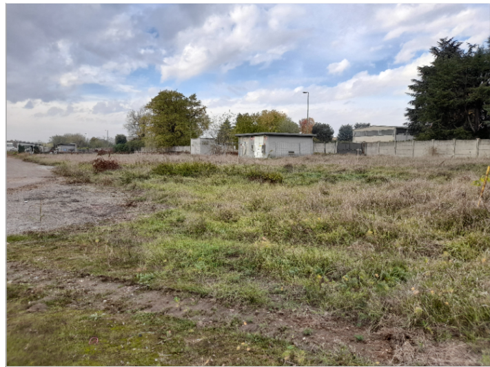
1. VISTA CONFINE OVEST