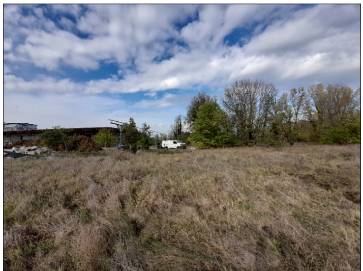
12. VISTA CONFINE OVEST