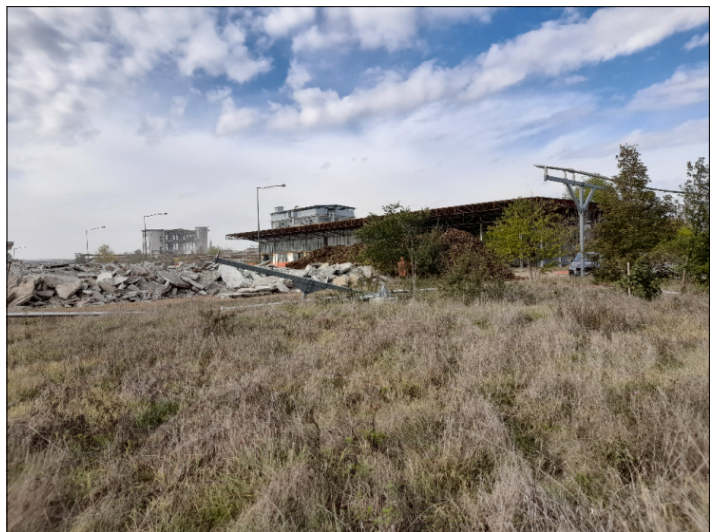
13. VISTA CONFINE OVEST