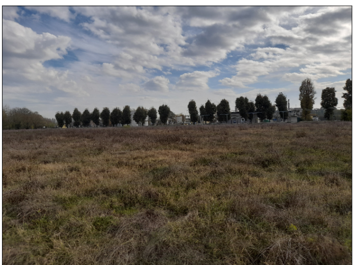
8. VISTA CONFINE SUD-EST