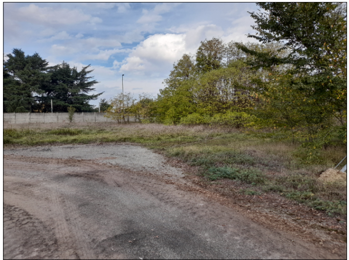
15. VISTA CONFINE OVEST