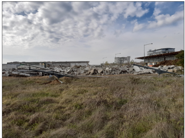
14. VISTA CONFINE OVEST