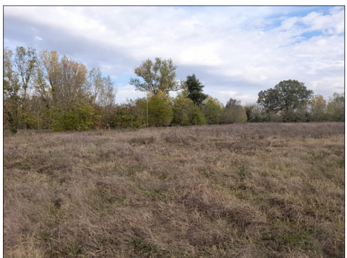
10. ALBERATURE NEL COMPARTO