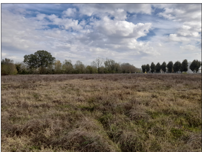
9. VISTA CONFINE NORD-EST