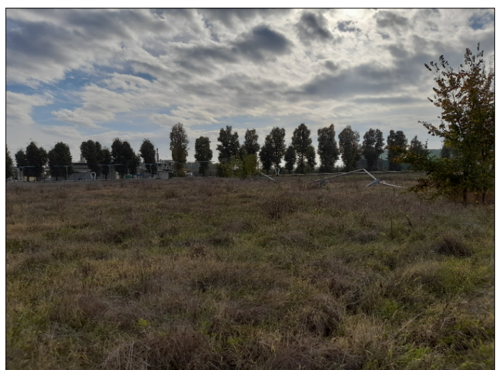
7. VISTA CONFINE SUD