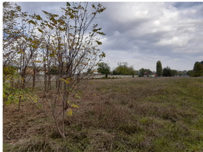
2. VISTA CONFINE NORD-EST