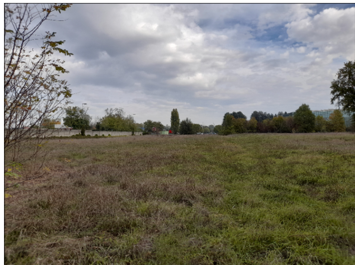
3. VISTA CONFINE NORD-EST