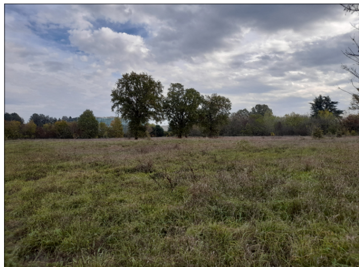
5. ALBERATURE NEL COMPARTO