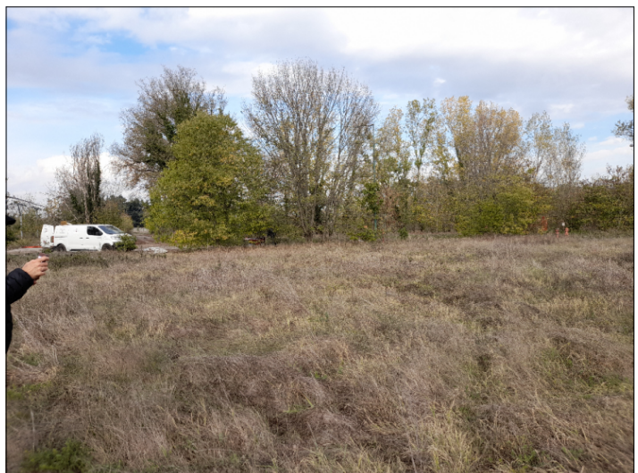
11. ALBERATURE NEL COMPARTO