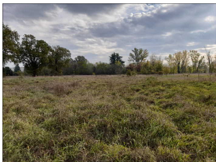
6. ALBERATURE NEL COMPARTO