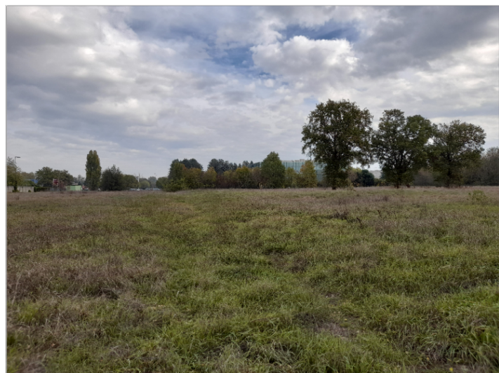
4. VISTA CONFINE NORD-EST