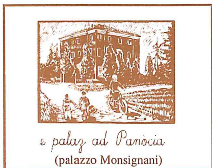
Comitato di Quartiere di Pievequinta-Caserma-Casemurate