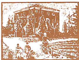
il palaz ad Panòcia (palazzo Monsignani)

Comitato di Quartiere di Pievequinta-Caserma-Casemurate