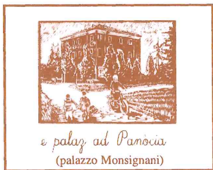
Comitato di Quartiere di Pievequinta-Caserma-Casemurate