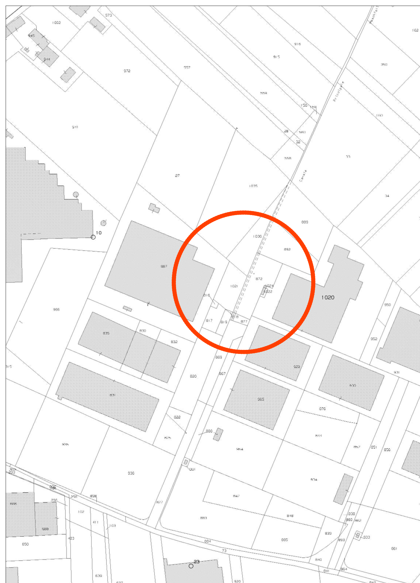
ESTRATTO DI MAPPA - scala 1:2000

Via Trieste n. 20/B- 31020 SAN VENDEMIANO (TV) - tel. 0438/778528 fax 0438/479245 e-mail: studiopec@studiopec.it