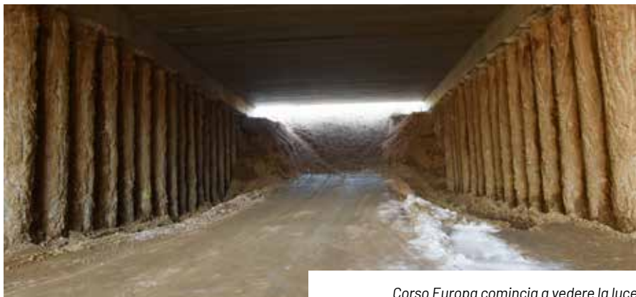
Corso Europa comincia a vedere la luce

A metà gennaio abbiamo assistito all'apertura della rotatoria lungo via Rho sul territorio comunale di Rho, proseguono speditamente i lavori per la realizzazione del sottopasso di