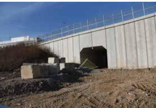
Un nuovo sottopasso ciclopedonale in via Manzoni

Più di tante parole... lasciamo spazio alle immagini che documentano la situazione attuale.