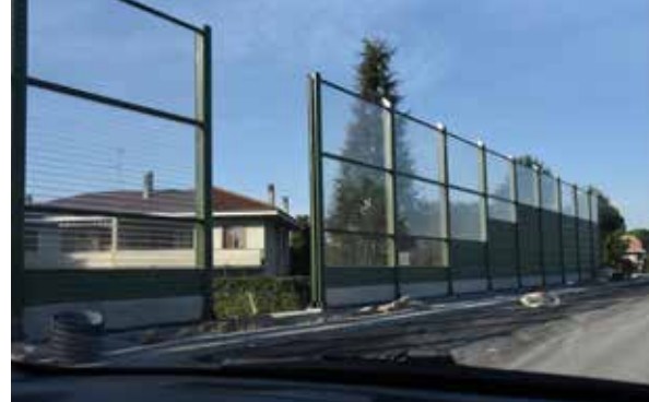
Le barriere antirumore installate vicino a via Marche