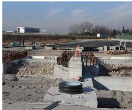
Lavori in corso per la realizzazione del nuovo casello autostradale