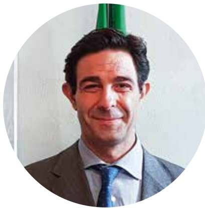
Il Sindaco Andrea Tagliaferro

A metà dell'anno 2020 il Consiglio Comunale di Lainate aveva unitariamente istituito il fondo Ripartenza, 700.000 euro destinati alla città per riprendersi e ripartire dall'evento traumatico dell'inizio della pandemia; 150.000 euro di questa cifra sono stati destinati alle associazioni che, dimostrandosi resilienti oltre che caparbie e appassionate, hanno realizzato tanti