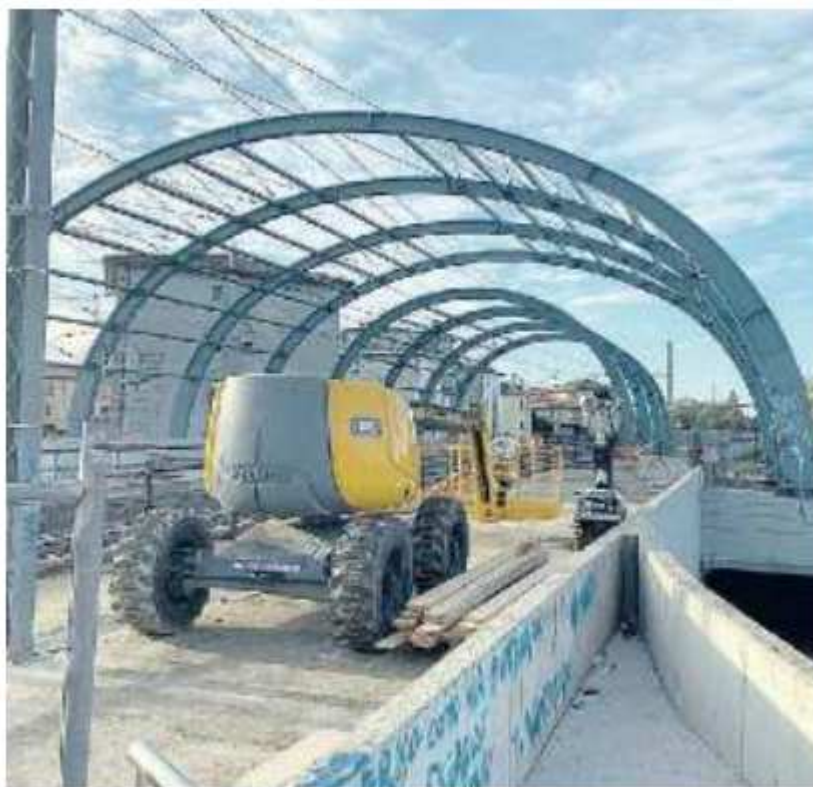
GRANDI OPERE La fermata Sfm di via Olimpia in costruzione

subito danni dal maltempo dell'estate scorsa ed evitare i tagli ai fondi per gli enti locali.