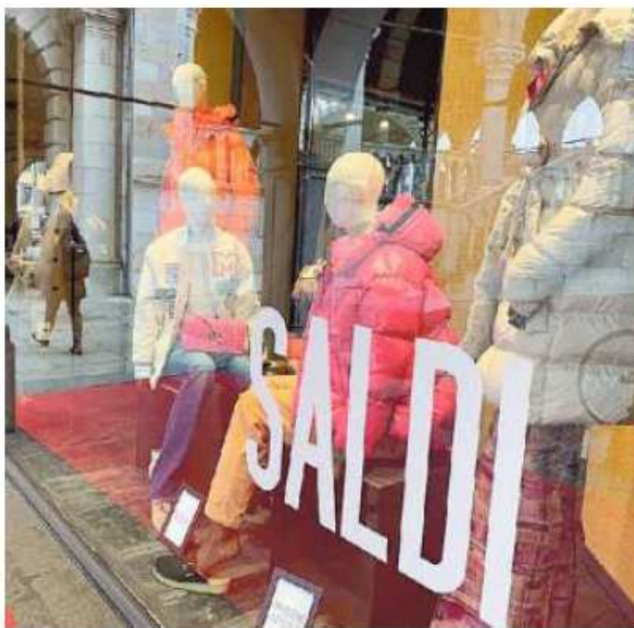
Domani inizieranno i saldi anche in provincia di Venezia

«È stata una stagione invernale non positiva, soprattutto per l'abbigliamento», spiega Canniello, «non positiva anche per le temperature miti, che hanno indotto nei consumatori poca propensione a comprare capi di abbigliamento invernali. Ci aspettiamo che i saldi possano riequilibrare un po' questa situazione. Durante il Natale e le festività, gran parte delle merce è già stata adocchiata dai clienti, che ora aspettano i saldi per fare gli acquisti di quello che serve. Per la stessa natura dei saldi, ci aspettiamo che siano privilegiati i centri città rispetto al commercio online. Infine, ci aspettiamo una grande attenzione da parte del consumatore a cercare l'affare e l'acquisto utile,