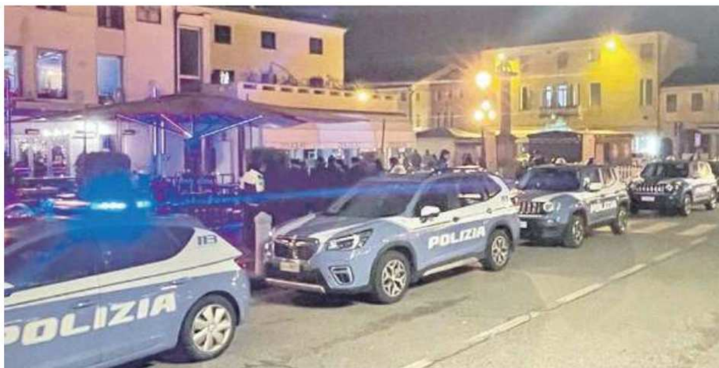
MIRANESE Le pattuglie della polizia durante i controlli che sono iniziati mercoledì sera. Sopra il parco Nuove Gemme di Spinea

Giovedì 4 Gennaio 2024 www.gazzettino.it