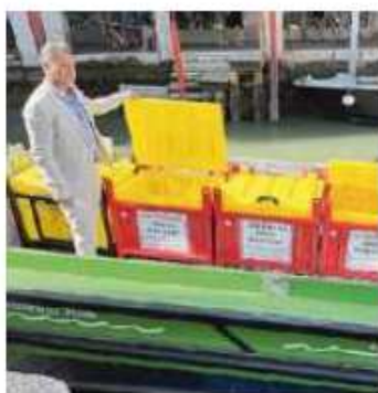
Contenitori per rifiuti urbani

Il Comune di Venezia ha appena approvato il progetto per il nuovo centro raccolta in via Porto di Cavergnago, sede degli uffici di Veritas. Anche qui, spiega Razzini, tante le novità. «Nel 2024 è prevista la realizzazione di quelli di Spinea e Mestre, mentre sono in progettazione quelli di Mira, Vigonovo, Jesolo. Sono infrastrutture rilevanti e molto importanti