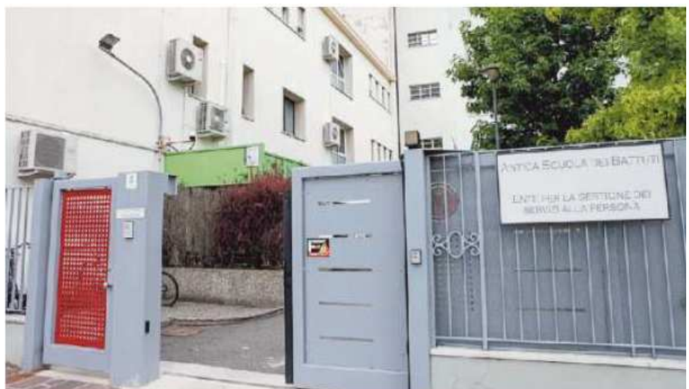
La residenza sanitaria di via Spalti a Mestre, gestita dall'Antica Scuola dei Battuti

ai 74 euro. I 74 euro sono applicati anche dalla "Anni azzurri" di Favaro. A Fiesse d'Artico alla struttura La Salute si applicano poco più di 71 euro. Tra i 62 e i 66 euro si collocano le tariffe praticate da Santa Maria del Rosario, Anni Sere-