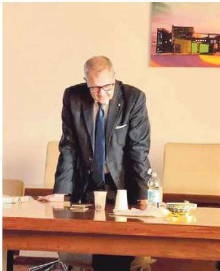
Il prefetto Darco Pellos in visita a Spinea