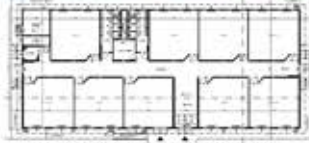
FABBRICATO DIETRO ALLA SCUOLA ELEMENTARE ANNA FRANK NELL'AREA DELL'AMALDI - SRAFFA