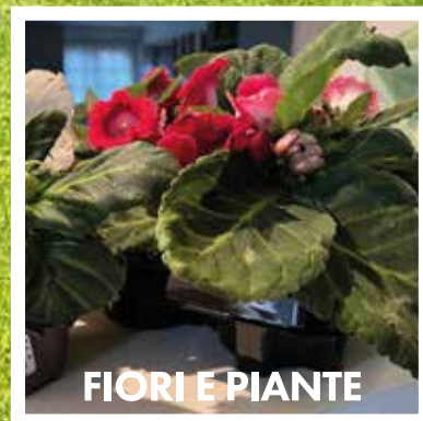
FIORI E PIANTE

Tante offerte per casa, giardino e terrazzo