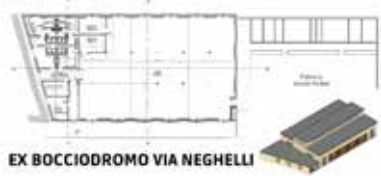
EX BOCCIODROMO VIA NEGHELLI