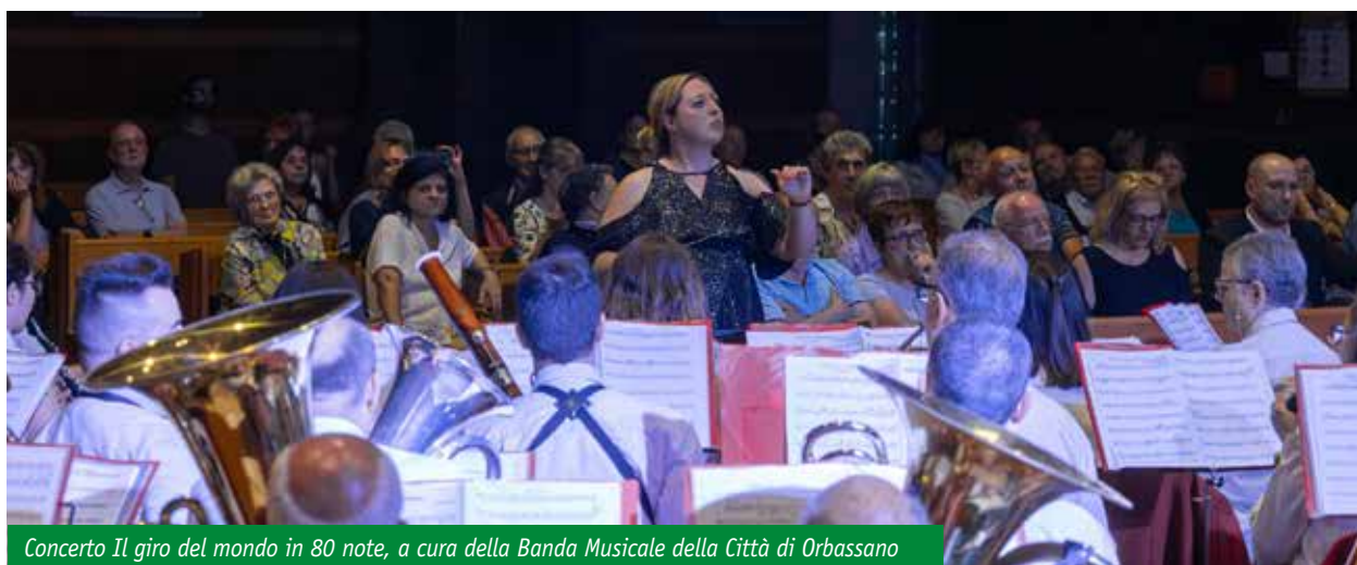
Concerto Il giro del mondo in 80 note, a cura della Banda Musicale della Città di Orbassano