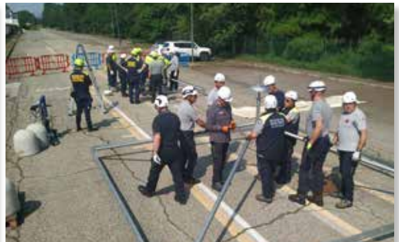
Esercitazione protezione civile: sessione di addestramento di montaggio delle pagode e della tensostruttura ILMA