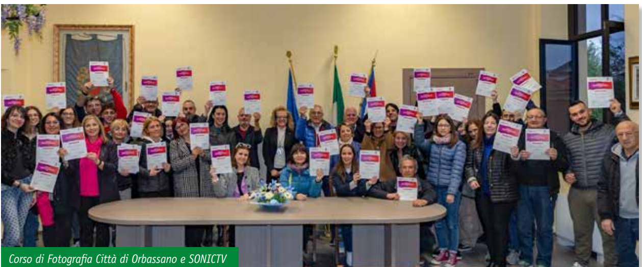
Corso di Fotografia Città di Orbassano e SONICTV