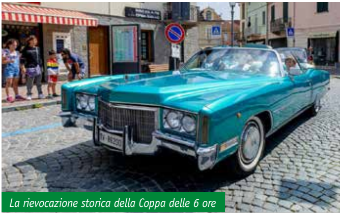
La rievocazione storica della Coppa delle 6 ore