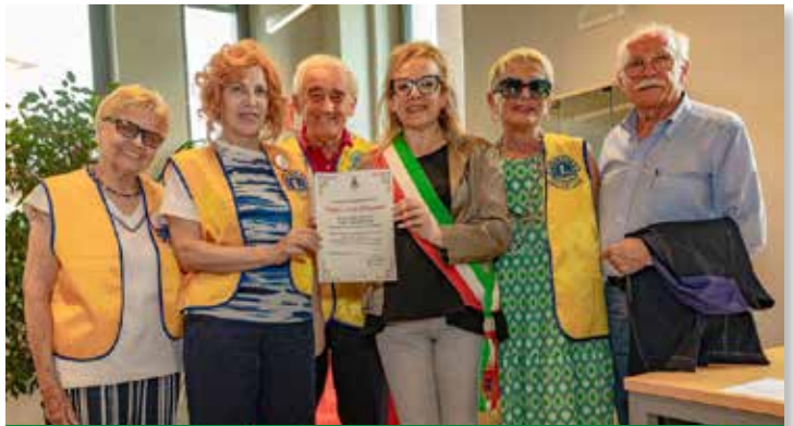
Lions Club ha donato un videoingranditore alla Biblioteca Civica C. M. Martini