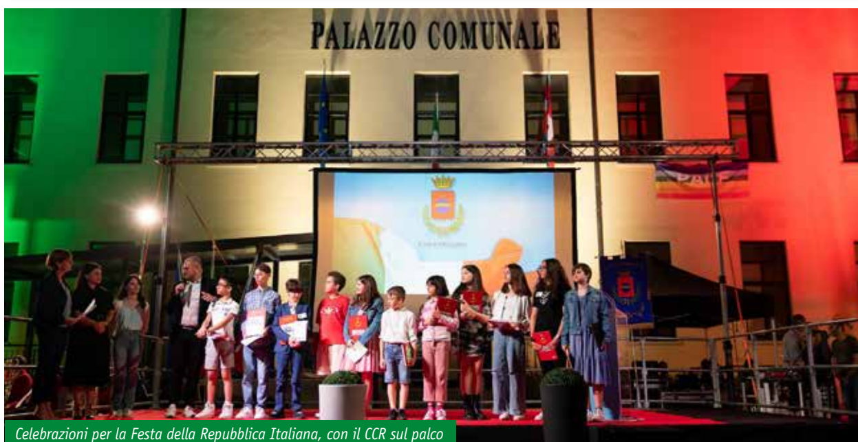
Celebrazioni per la Festa della Repubblica Italiana, con il CCR sul palco