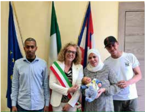
Conferimento della cittadinanza italiana ai concittadini