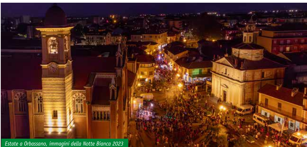
Estate a Orbassano, immagini della Notte Bianca 2023