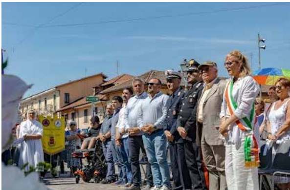
Santa Messa del 24 Giugno - S. Patrono della Città di Orbassano, San Giovanni Battista