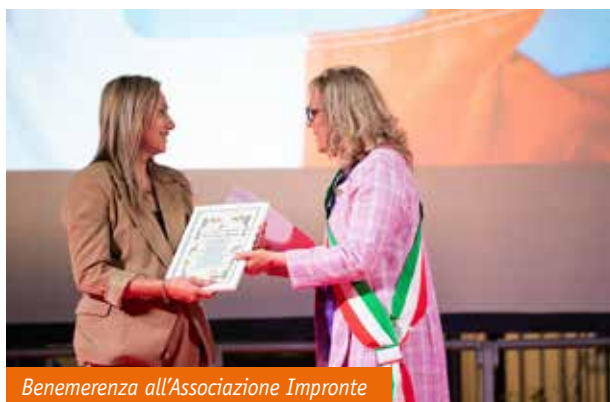
Benemerenzza all'Associazione Impronte

La Festa della Repubblica Italiana del 2 Giugno rappresenta un momento importante per tutta la nazione. La città di Orbassano da anni celebra questa ricorrenza con una serata rivolta a tutta la comunità, con diversi momenti dedicati a cittadini e cittadini orbassanesi.