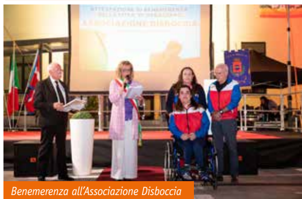
Benemerenzza all'Associazione Disboccia