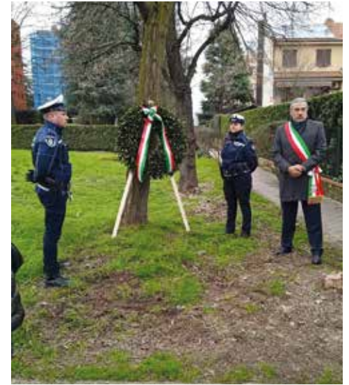
Deposizione Corona per la Giornata della Memoria al Parco Vittime dell'Olocausto