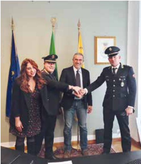
Buon lavoro al nuovo comandante della nostra Polizia Locale Danilo Cilano