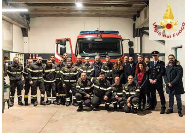
Aperto il nuovo distaccamento dei Vigili del Fuoco a Peschiera Borromeo, a giugno l'inaugurazione ufficiale per tutti i peschieresi