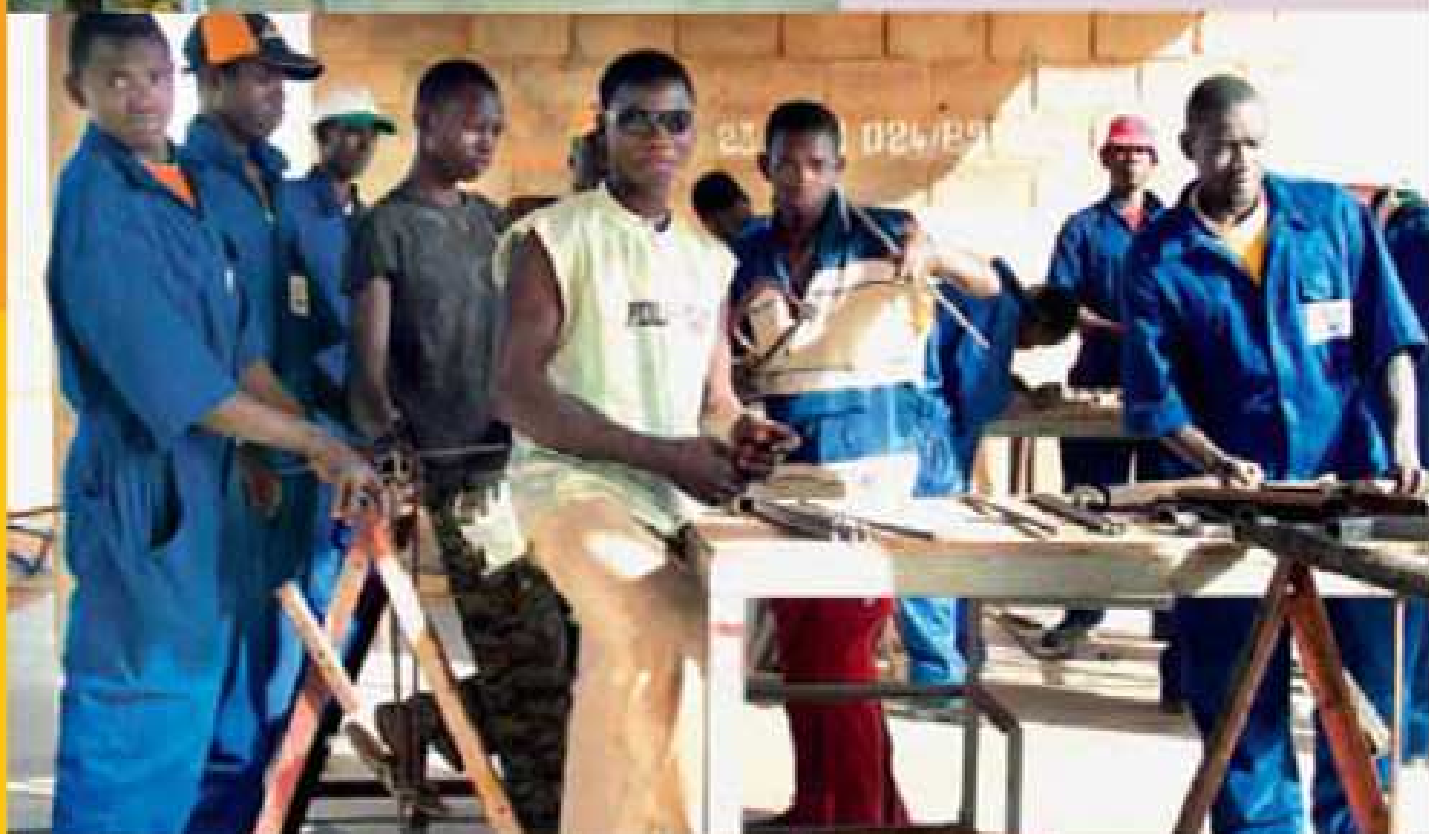
Qui sopra, a lato e a p. 10, Scuola di formazione professionale (meccanici, falegnami, muratori, elettricisti idraulici e saldatori) a Dori, gestita dall'ANPE (Agenzia Nazionale per l'Impiego).