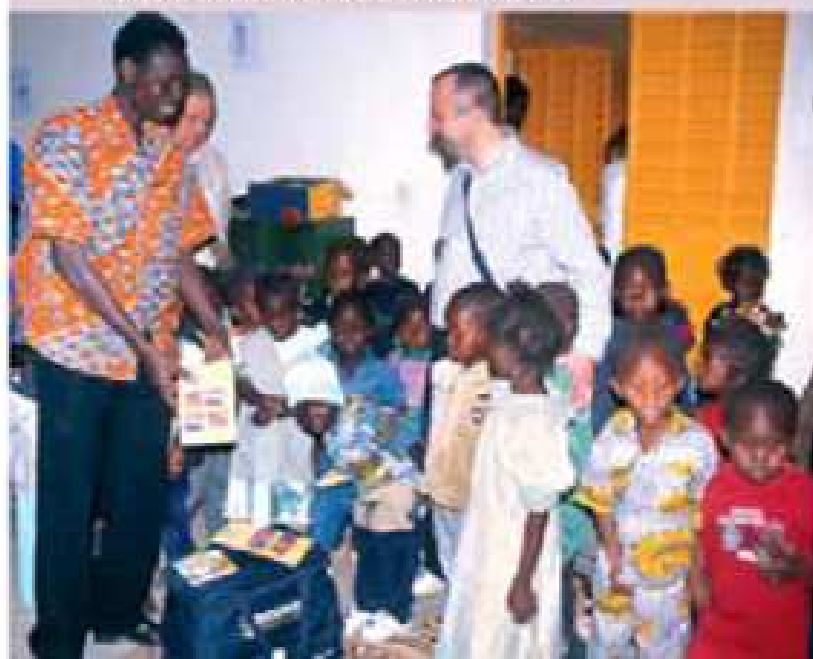
Alcuni alunni della scuola materna.

La strategia consiste però anche nel creare le condizioni affinché diventi un interesse vero e un obbligo sociale per la famiglia e per i responsabili dei villaggi mandare i ragazzi a scuola.