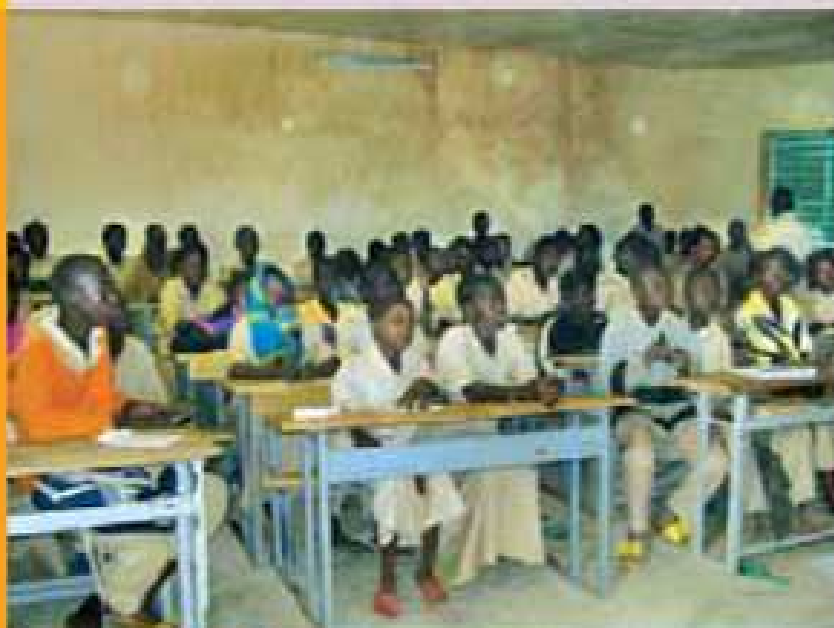
Una classe del Liceo statale di Gorom-Gorom.