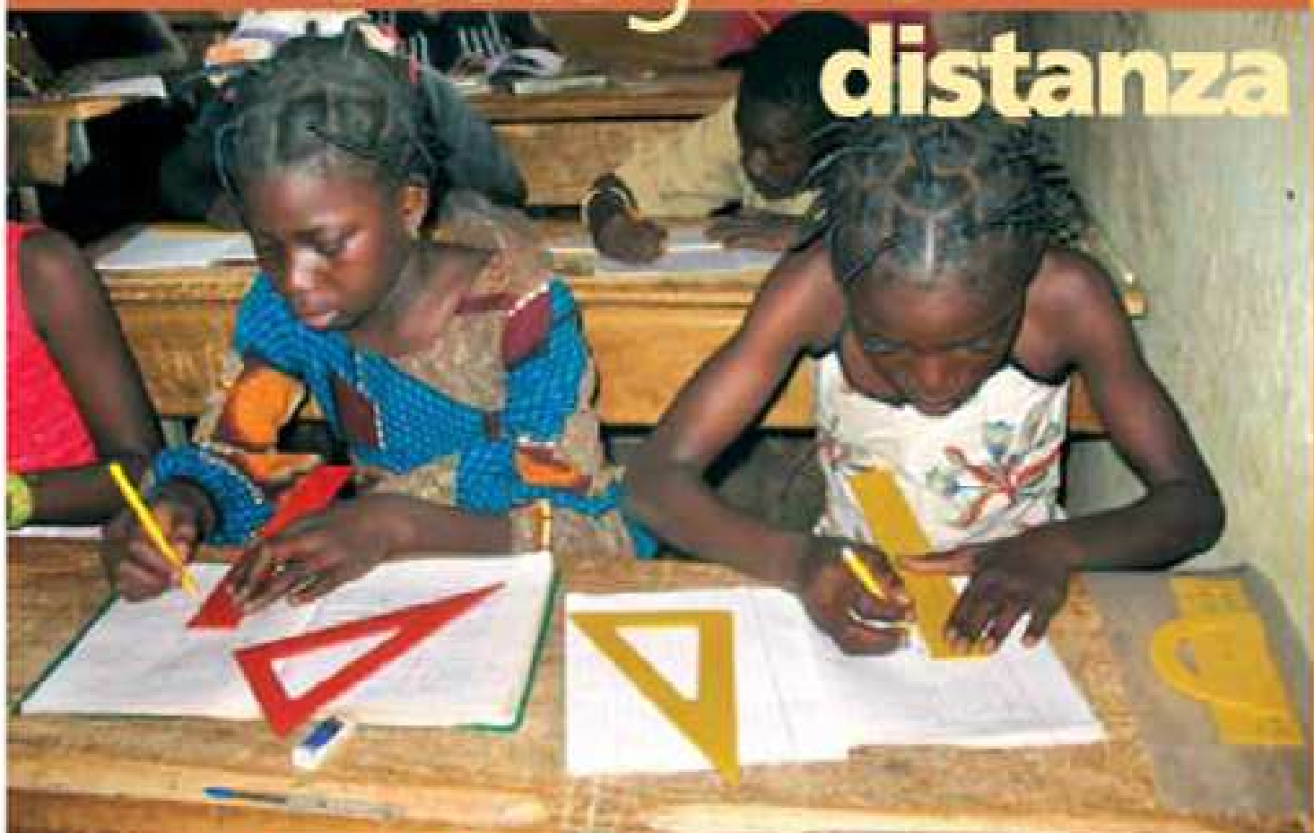
Alcune fanciulle di una scuola elementare.

Il futuro dell'Africa deve essere in mano agli Africani. Questo è il principio che guida l'impegno LVA nel Sud del mondo. Ogni società, per crescere e svilupparsi, ha bisogno di investire sui giovani, in particolare sull'istruzione, affinché sia possibile formare le future classi dirigenti e le future classi medie: agricoltori, artigiani, imprenditori, tecnici, professionisti e intellettuali che daranno gambe e testa al Paese, per camminare, ideare, produrre. Per rispondere autonomamente ai propri bisogni.