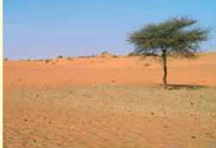
Zona desertificata nell'Oudalan.

La regione del Sahel, in particolare, è la più povera del Burkina. L'eccessivo utilizzo del terreno introdotto dal dominio coloniale, temperature elevate, venti intensi e piogge scarse hanno causato un processo di