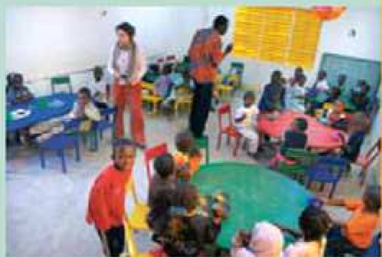
Immagine parziale dell'unica scuola materna dell'Oudalan, costruita con il nostro sostegno.

Non tutti i villaggi sono provvisti di strutture scolastiche, e il bambino si troverebbe costretto a percorrere diverse ore di cammino al giorno, a piedi, per recarsi in classe. Nelle aree rurali, come quella di Gorom-Gorom, la situazione è aggravata dall'elevato tasso di abbandono scolastico, dovuto alla stretta dipendenza del reddito familiare dal raccolto stagionale: quando il raccolto va male, per la maggior parte delle famiglie risulta praticamente