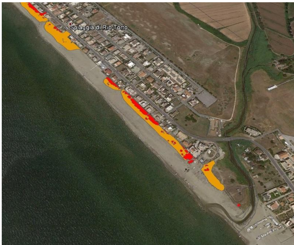
Figura 2 Mappatura di dettaglio per le categorie di vegetazione dunale costiera (in giallo) e per i popolamento di specie invasive (in rosso)