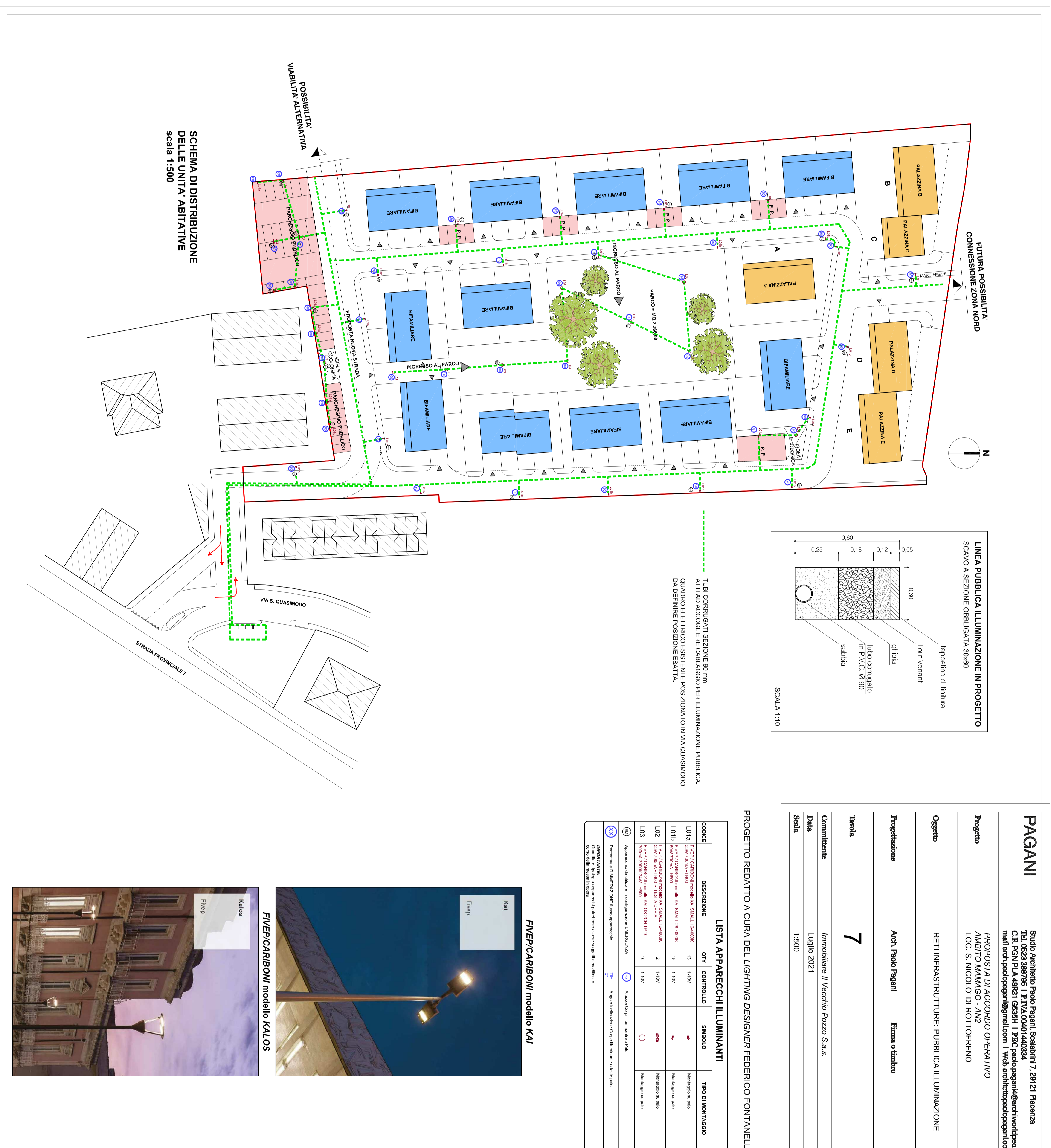
SCHEMA DI DISTRIBUZIONE DELLE UNITA' ABITATIVE Scala 1:500